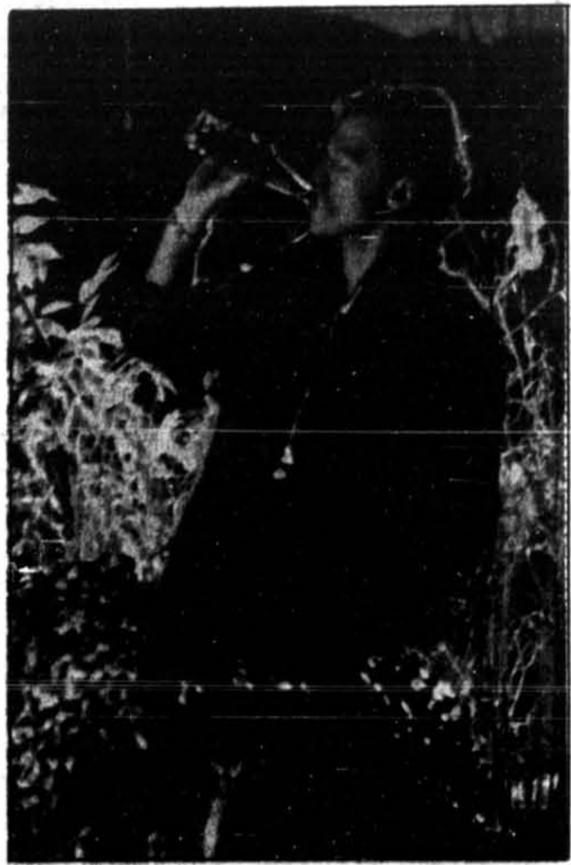
Claude Dong Meunier et la publicité Pepsi