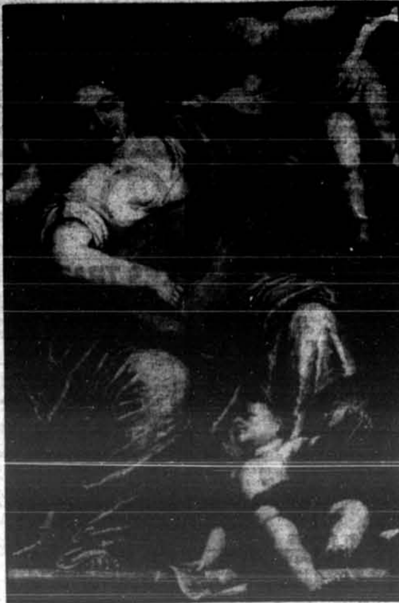
«Muse de la musique», le tableau attribué à Véronèse disparu de l'université de Trent.

Comme la pièce où se trouvait le tableau était fermée à clé et