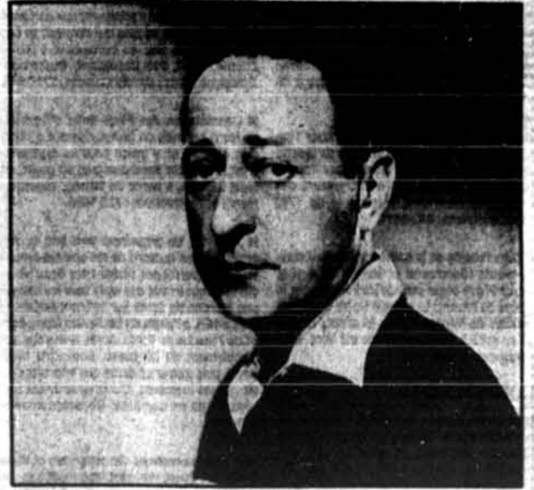
Jascha Heifetz en 1952

En 1917, fuyant la Révolution russe, Heifetz émigre aux États-Unis et devient, en 1925, citoyen américain. La gloire commence pour ce virtuose à l'impassibilité légendaire — on