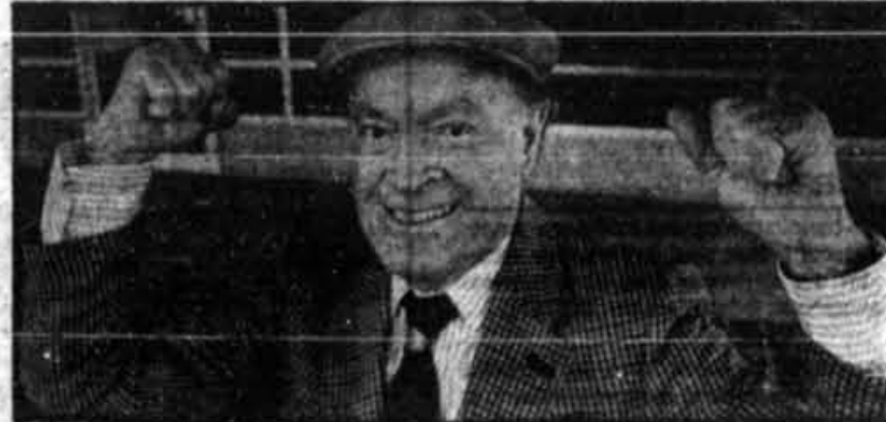
Bob Hope l'an dernier

Le département de la Défense n'a pas indiqué la date du départ du comédien ni les endroits où il doit se produire.