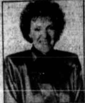
Par LISE BOURBEAU, psychothérapeute et fondatrice des Centres ÉCOUTE TON CORPS.

Le temps des fêtes est toujours un temps d'émotions; la raison principale est l'emprise des traditions québécoises et l'incapacité d'être vrai.