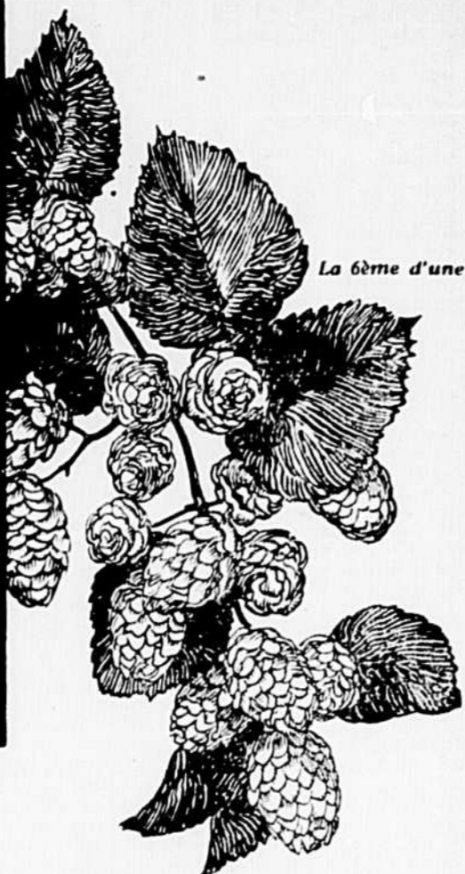
La graine d'une série

Les meilleurs houblons au monde servent à la fabrication de la