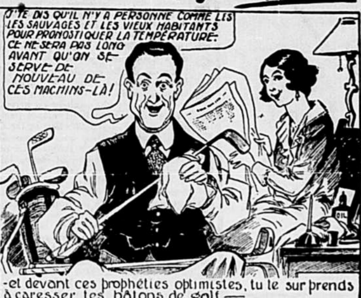
-et devant ces prophéties optimistes, tu le surprends à caresser les bâtons de golf