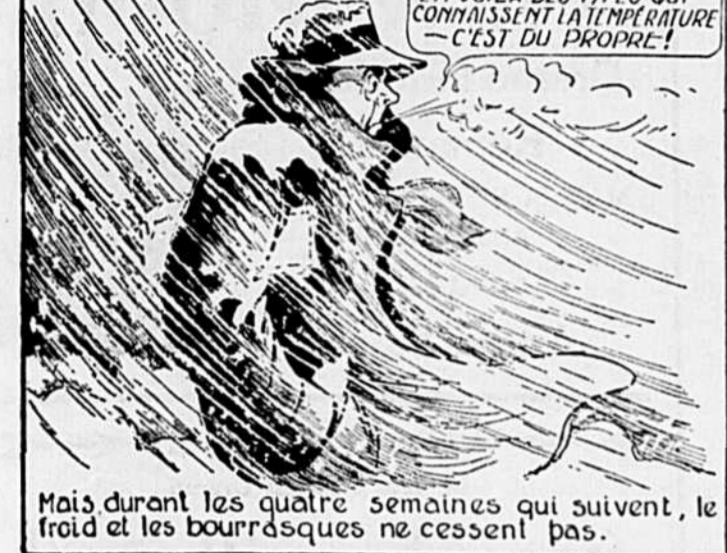
Mais durant les quatre semaines qui suivent, le froid et les bourrasques ne cessent pas.