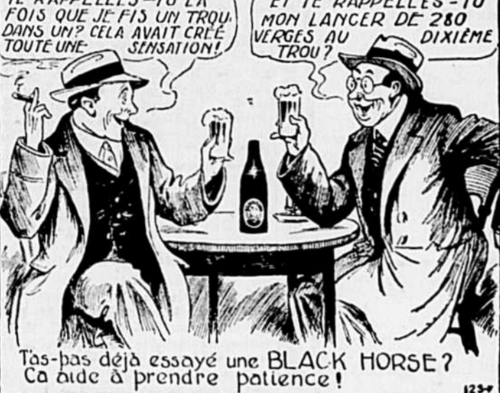
Tas-pas déjà essayé une BLACK HORSE? Ça aide à prendre patience!

dites simplement - "Bière Black Horse Dawes s.v.p."!