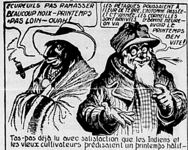
Tas-pas déjà lu avec satisfaction que les Indiens et les vieux cultivateurs prédisaient un printemps hâtif-