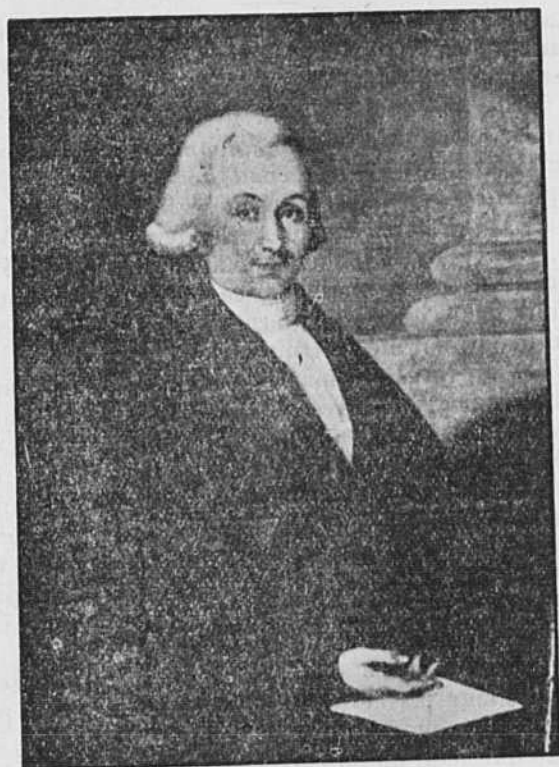
L'HONORABLE JEAN-ANTOINE PANET PREMIER ORATEUR DE LA CHAMBRE D'ASSEMBLÉE