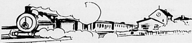
Le train de sept heures.

Il s'enferma dans sa bibliothèque et y passa cinq ou six heures.