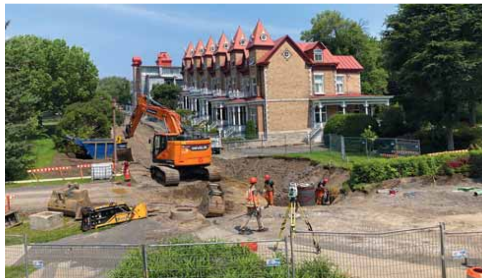
La nature des travaux consiste au bouclage du réseau d'aqueduc entre l'avenue Royale, l'avenue du Couvent et la rue de l'Académie.

« Il y a longtemps que nous attendions cet heureux événement qui va contribuer à revitaliser le Vieux-Beauport. Déjà en 2006 on discutait du réaménagement de ce parc. Cette annonce est le fruit d'une réussite collective à laquelle