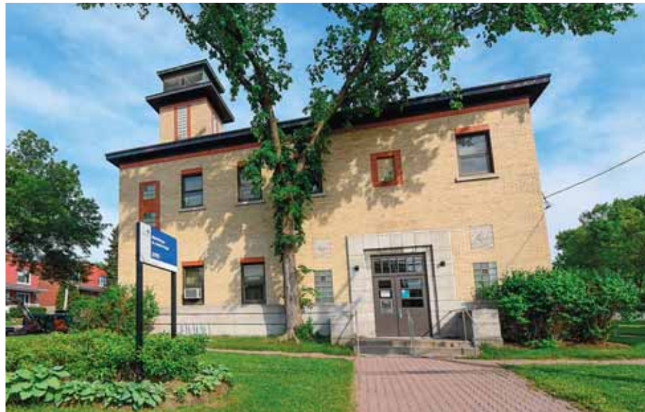
Les heures d'ouverture seront augmentées à la bibliothèque du Chemin-Royal jusqu'à la fin des travaux à la bibliothèque Étienne-Parent en mars 2026.

Les usagers et les usagères pourront ainsi profiter d'un point de cueillette temporaire pour les retours et les réservations de documents au Centre sportif Marc-Simoneau, situé au 3500, rue Cambronne. Ce point de cueillette sera ouvert du lundi au vendredi de 10h à 20h et le samedi et le dimanche de 10h à 17h. La chute à documents, située dans l'entrée du centre sportif, sera accessible de 7h à 23h.