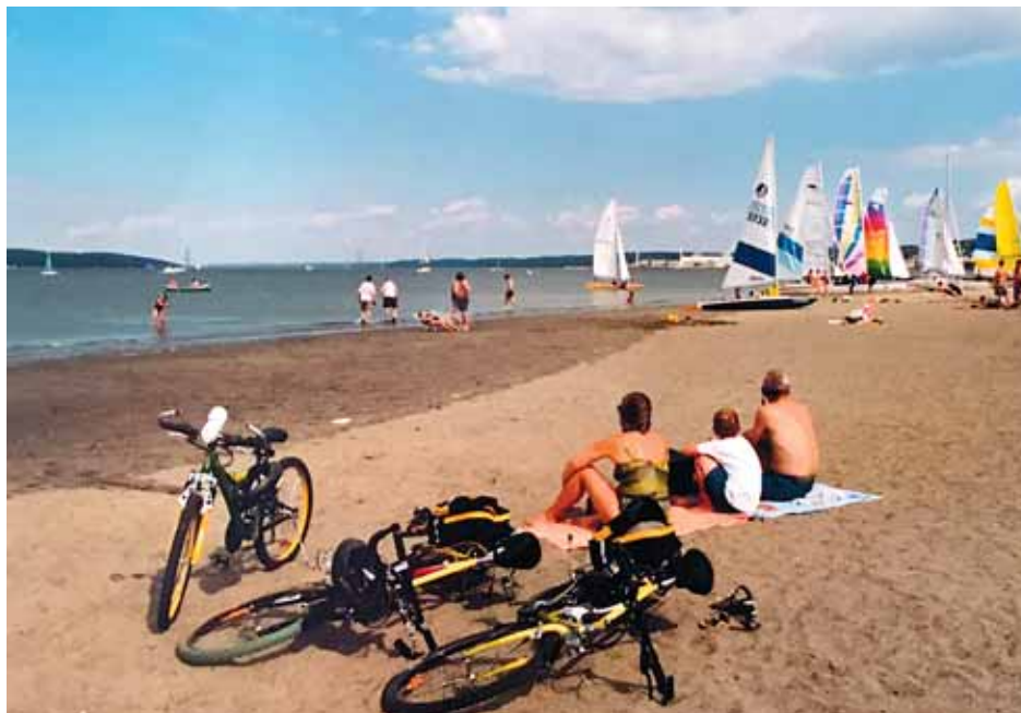
Depuis le début de la saison, les baigneurs ont pu avoir accès pendant seulement 13 jours à l'eau du fleuve sur le site de la baie de Beauport.

Un contact direct avec une eau de mauvaise qualité peut mener des problèmes de santé, comme des gastro-entérites, des infections des yeux et des problèmes de peau, indique le CIUSSS de la Capitale-