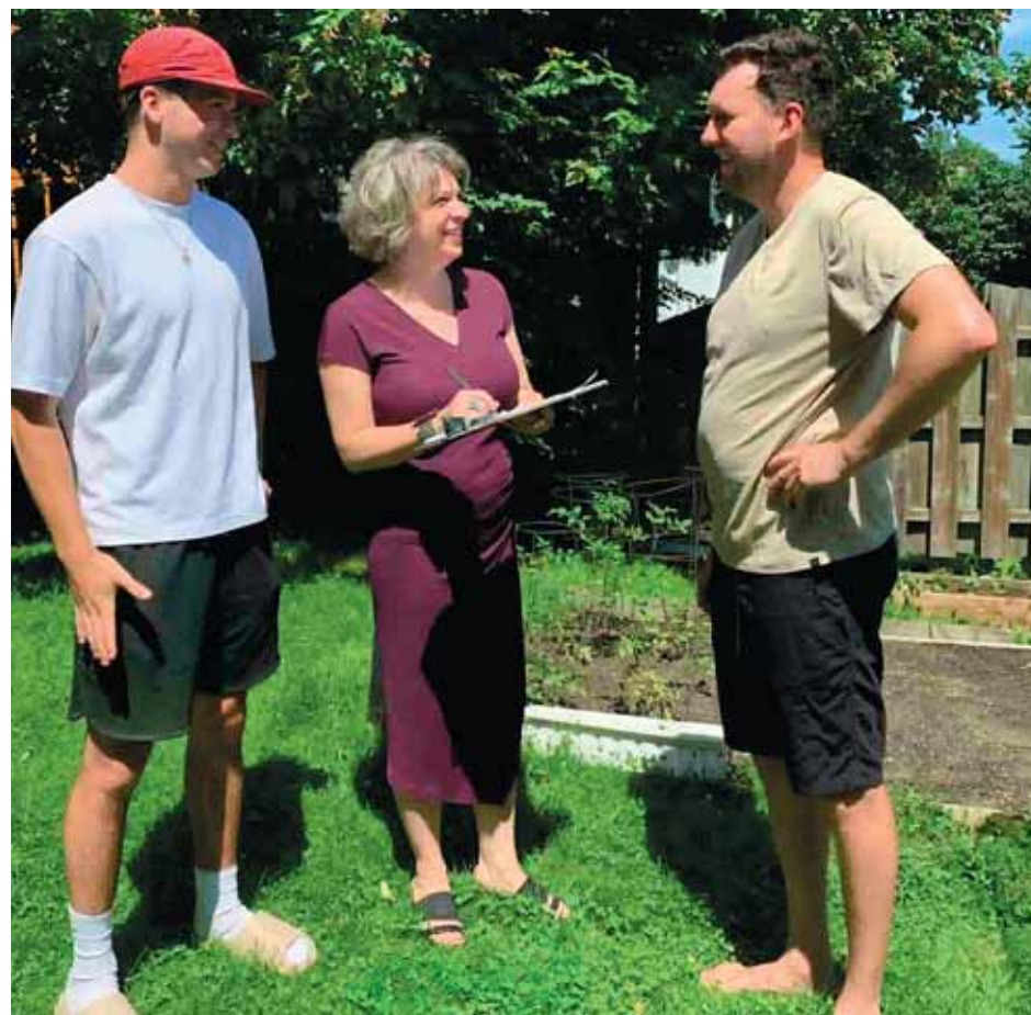
Afin de déposer la demande officielle à la Ville, il est nécessaire d'avoir recueilli 300 signatures de citoyens du quartier. Des visites sont d'ailleurs prévues durant l'été.

Les personnes intéressées sont invitées à y ajouter leur signature afin d'appuyer cette demande. Pour celles désirant s'impliquer davantage dans la démarche, voire même à faire partie du conseil lorsqu'il sera mis sur pied, elles sont invitées à écrire à l'adresse comitecvieuxmoulin@gmail.com . ●