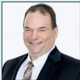
PAR SERGE BEAULIEU PRÉSIDENT