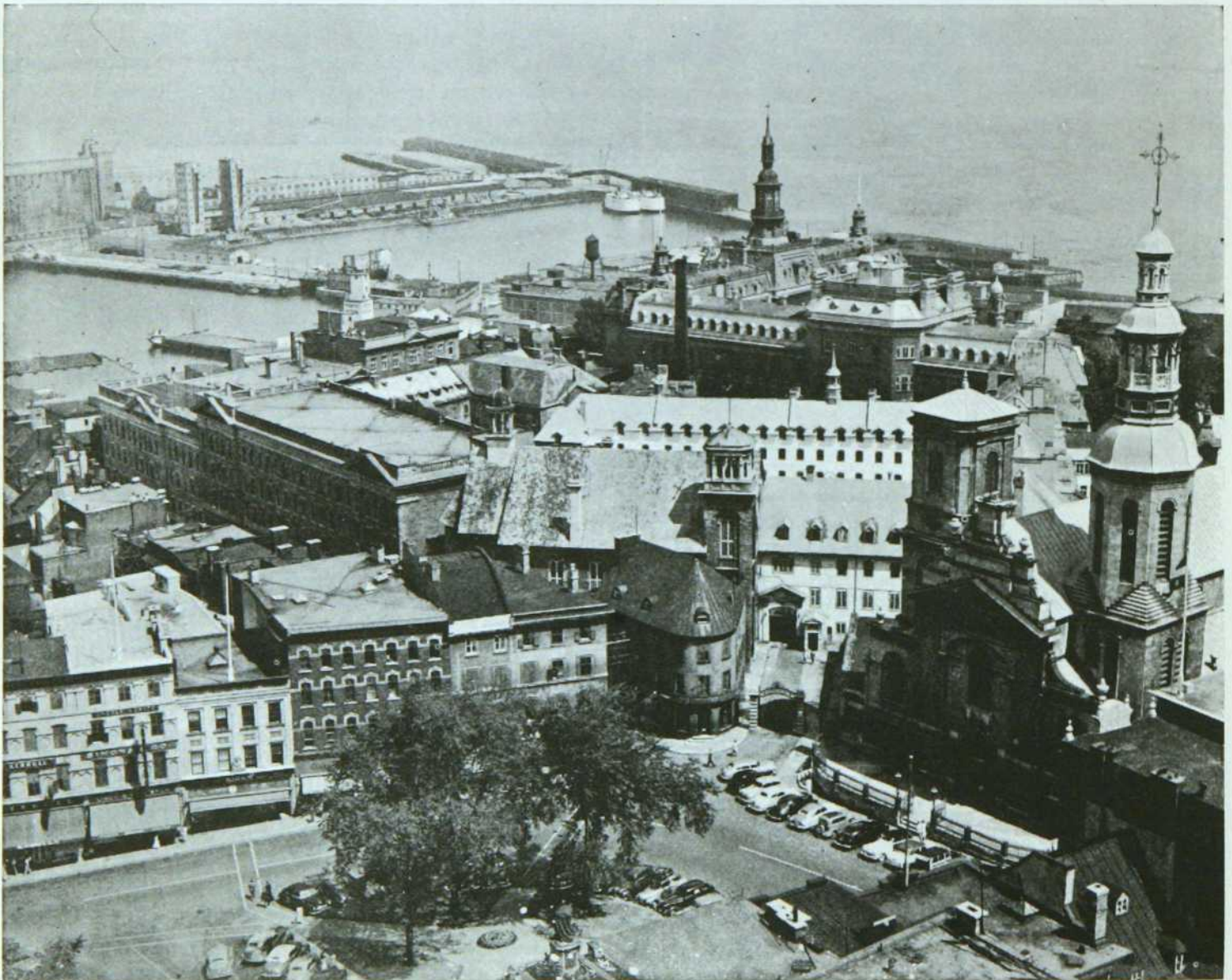
UNE PARTIE DU VIEUX QUEBEC

Quebec City, the population of which exceeds 165,000, will attain in the relatively near future, according to the present rate of increase, 200,000.