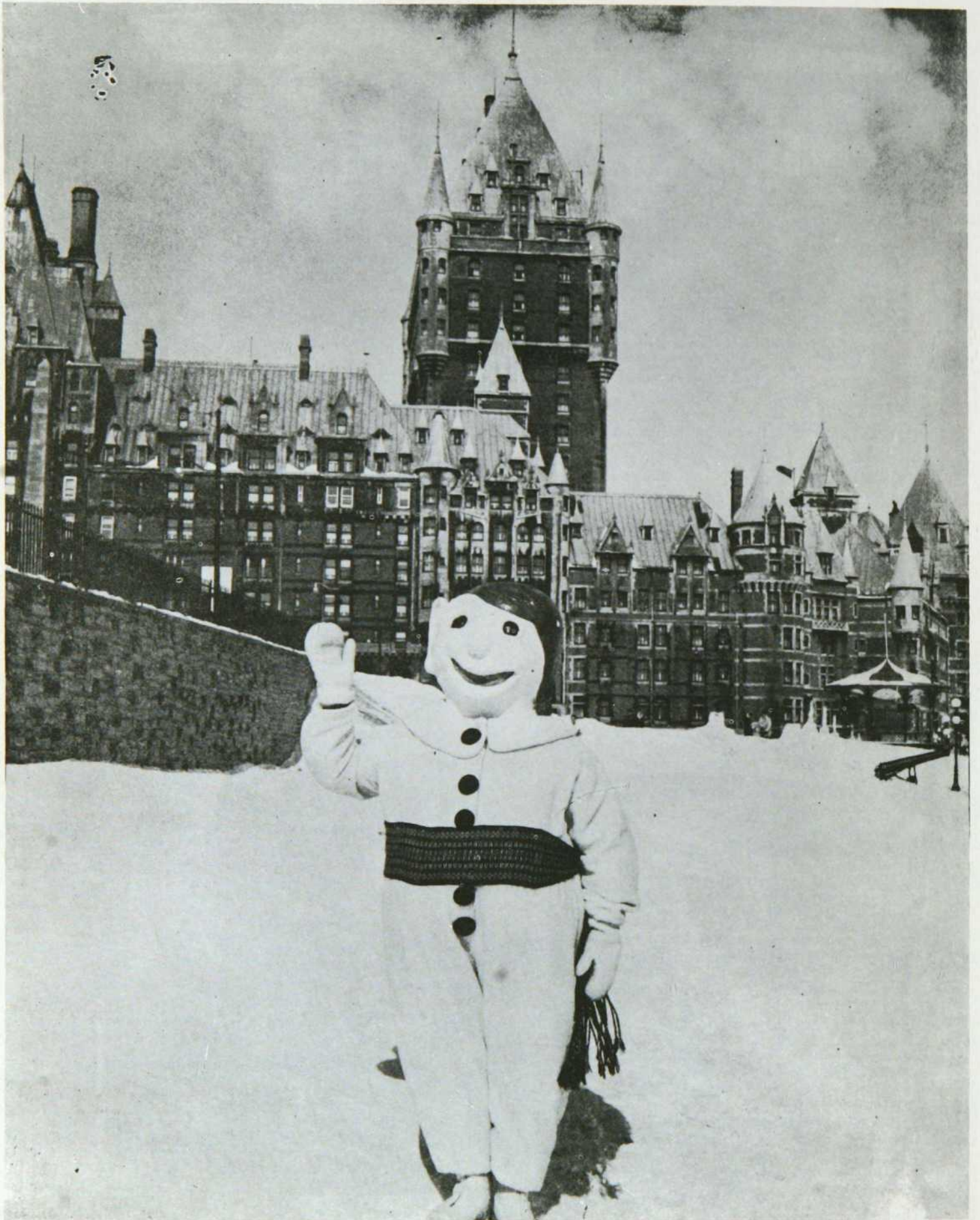
Le Château Frontenac