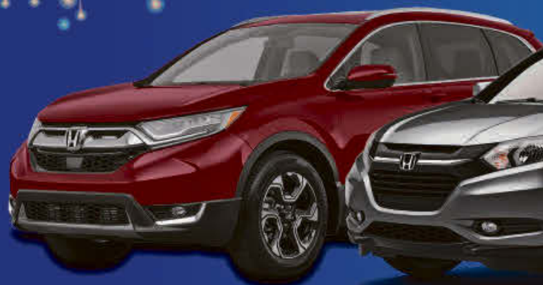
Honda CRV 2017

LOCATION À PARTIR DE 48$ /SEM. Civic 2017