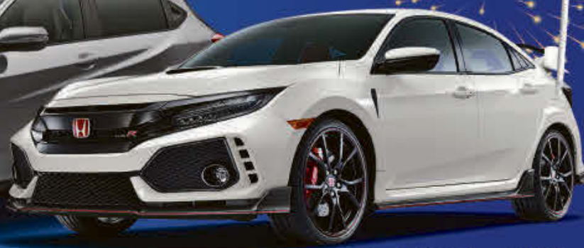
Honda Civic Type R 2017