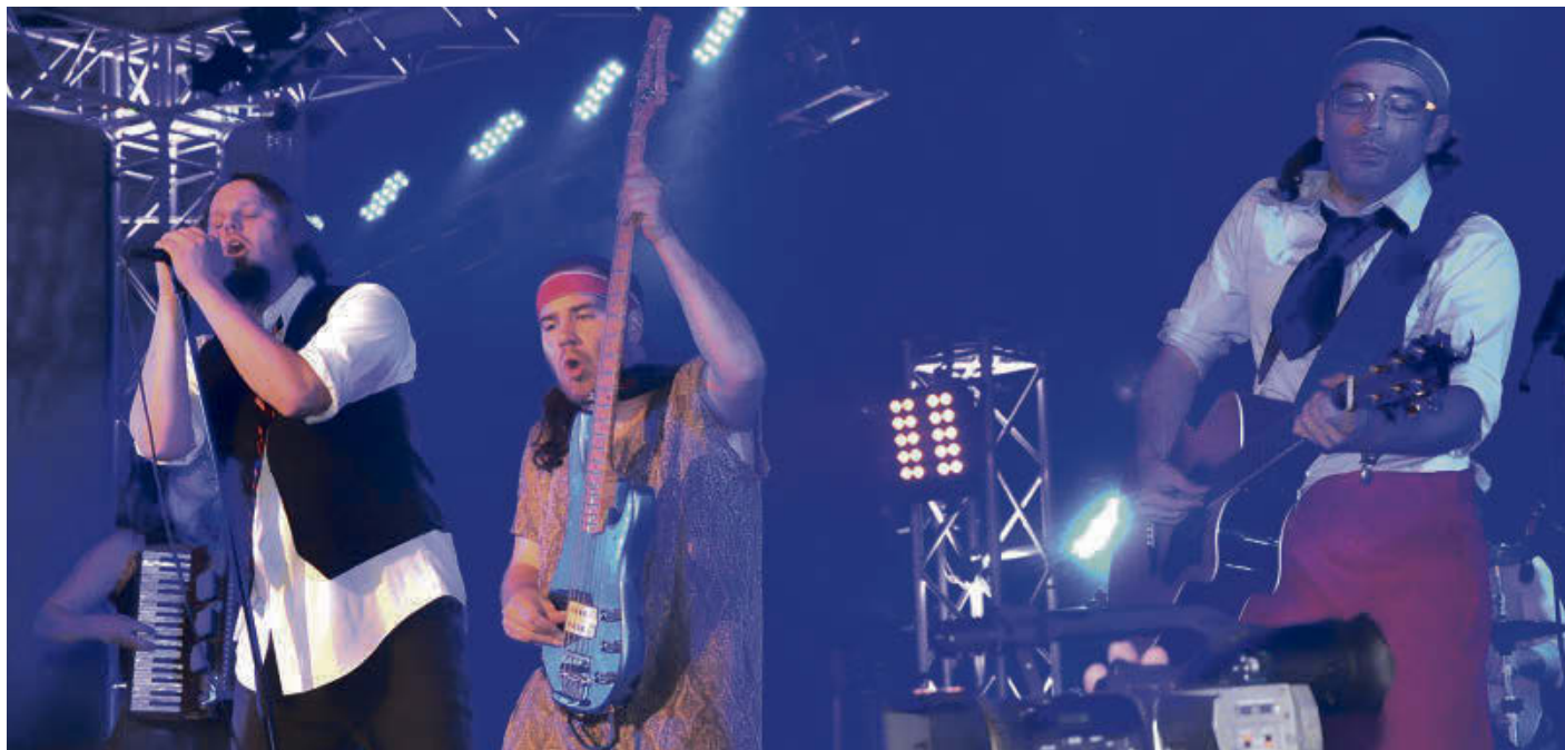
Les Cowboys Fringants, qui ont survolté la scène du Show de la rentrée il y a trois ans, seront de retour à Acton Vale ce samedi 19 août.

« Avec la présence de Simple Plan l'an dernier, le Show de la rentrée a haussé sa visibilité à travers le Québec. Le bouche à oreille est très fort, car nous sommes reconnus entre autres pour la beauté de notre site et l'accueil chaleureux des gens