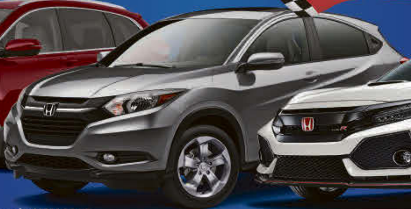
Honda HRV 2017