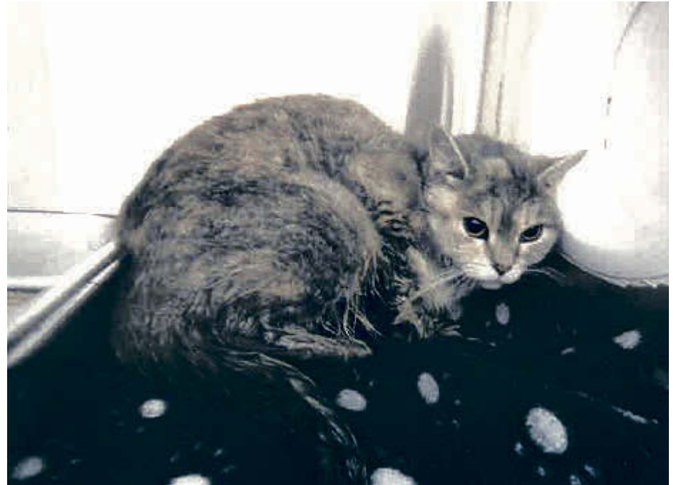
Maya, une chatte négligée et abandonnée à elle-même dans un logement de Valcourt, a dû être euthanasiée par la SPA de l'Estrie.

Pour joindre la SPA (ou faire une plainte de manière confidentielle): 819 821-4727, option 5.