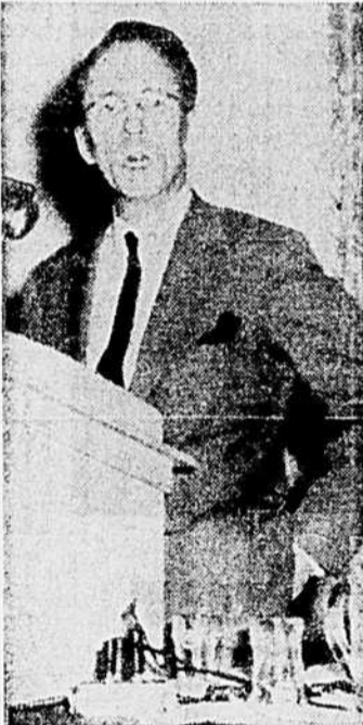
Le premier ministre "Tommy" DOUGLAS: D'après le Comité provincial du NP, il pourrait donner au Nouveau Parti un "départ foudroyant".