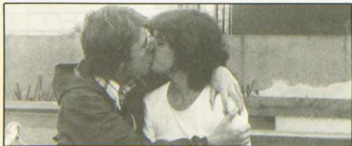
«L'Amour en herbe»