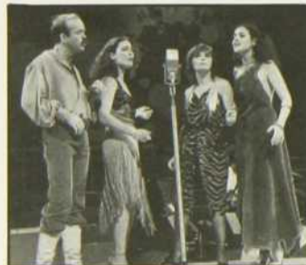
Diane Tell avec le groupe Trapèze