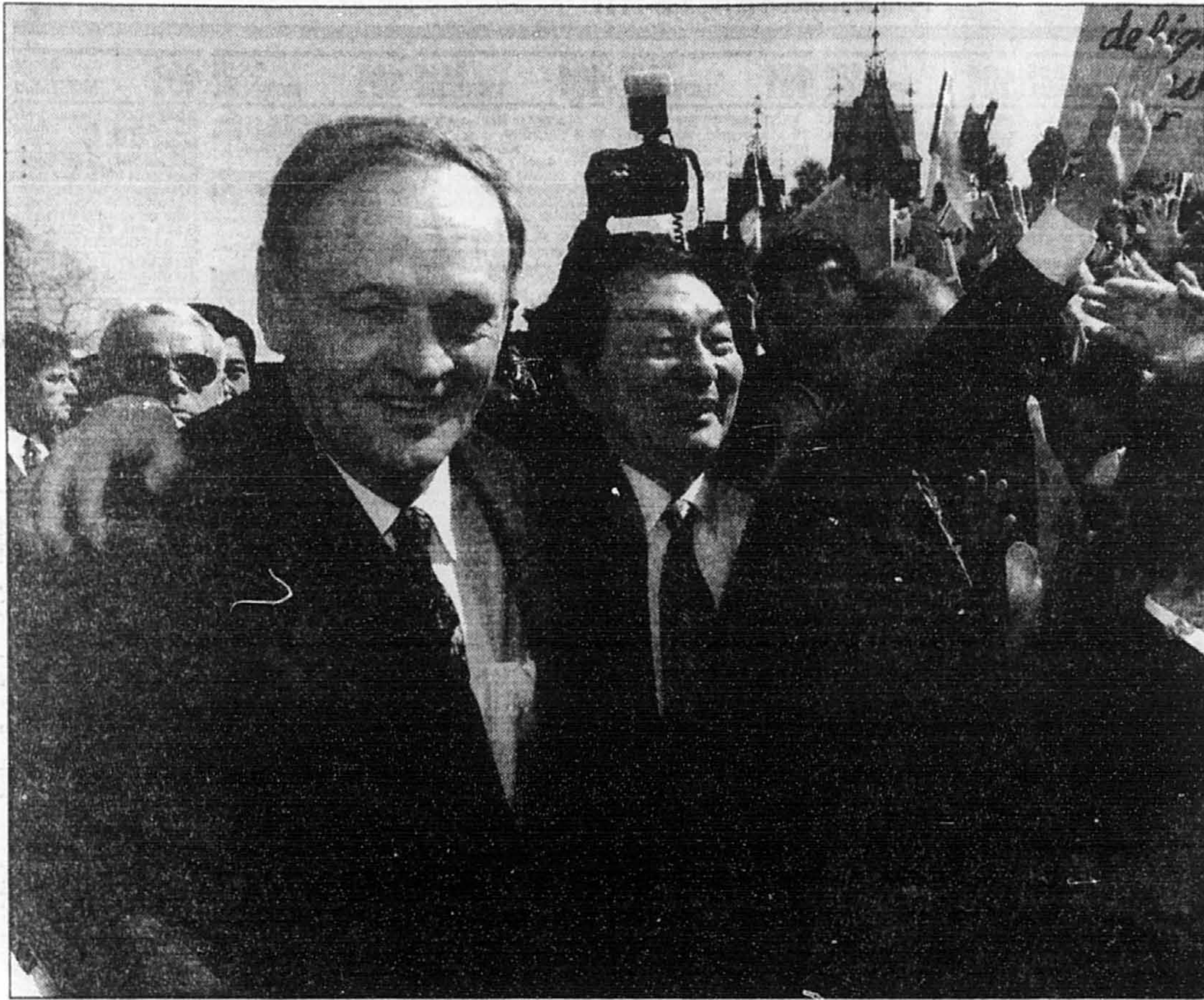
Le premier ministre Jean Chrétien et son homologue chinois Zhu Rongji ont pris un bain de foule hier sur la colline parlementaire, à Ottawa.