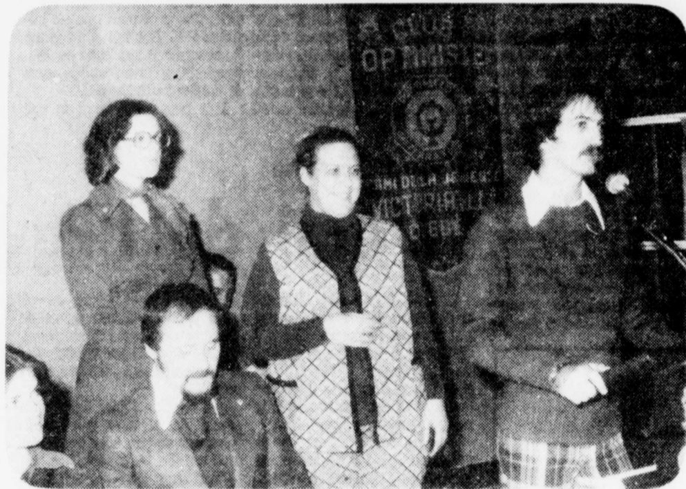
Nombreux invités des Optimistes

Les gens sont invités à aller célébrer à minuit et ensuite à réveillonner dans une atmosphère d'amour, de joie et de partage. Il y en aura pour tout le monde: les petits, les grands, les familles, les personnes seules. On priera,