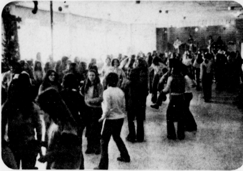
La danse était hier l'activité favorite des étudiants de l'école secondaire Lionel-Groulx, qui avaient entrepris plus tôt d'occuper leur école pour faire connaître les problèmes que leur apporte le conflit actuel dans l'enseignement.

Cette école reçoit 660 élèves des niveaux secondaire 4 et 5. L'occupation devait se terminer à la fin des heures normales de cours.