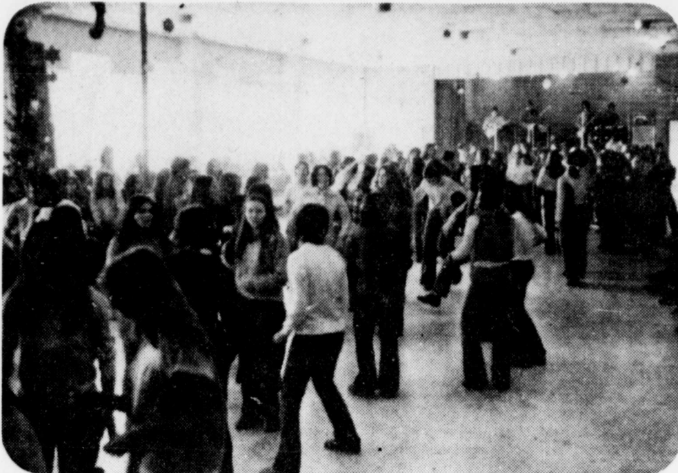
La danse était hier l'activité favorite des étudiants de l'école secondaire Lionel-Groulx, qui avaient entrepris plus tôt d'occuper leur école pour faire connaître les problèmes que leur apporte le conflit actuel dans l'enseignement. (Photo Francoeur).

Cette école reçoit 660 élèves des niveaux secondaire 4 et 5. L'occupation devait se terminer à la fin des heures normales de cours.