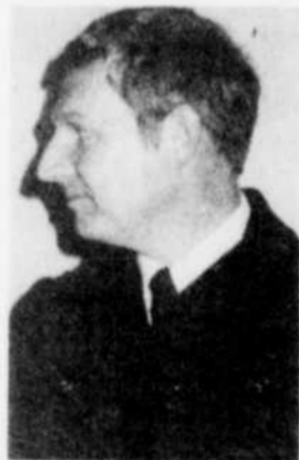
Le maire de Derby Line