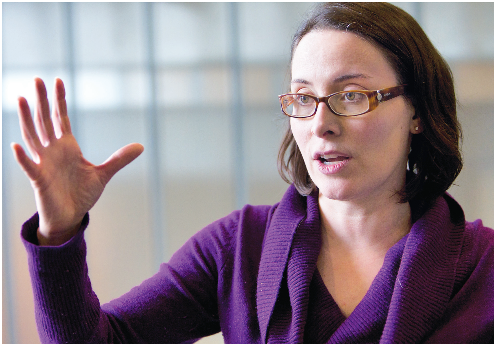
ANNIK MH DE CARUFEL LE DEVOIR

Quoi qu'on en dise, les champions de cette nouvelle économie ne sont pas condamnés à inventer le prochain Facebook ni à sortir de Polytechnique. À preuve, les lauréats des derniers Mercuriades, les prix remis annuellement aux meilleures entreprises au Québec. Sur les deux entreprises qui ont reçu le plus de prix, l'une était un géant du carton et du papier (Cascades) et l'autre un fabricant de cartouches d'impression réunies (La Recharge.ca). La première a été fondée par trois frères, l'un qui a étudié le génie civil, le deuxième qui est diplômé en science commerciale et le troisième issu d'une filière technique, alors que l'autre entreprise a été créée par un soudeur et un infographiste. Parmi les autres gagnants se trouvaient aussi une exportatrice de vêtements de plage à succès avec cours classique, une travailleuse sociale à la tête d'un projet immobilier innovateur et un pharmacien qui a réinventé la vente de livres scolaires.