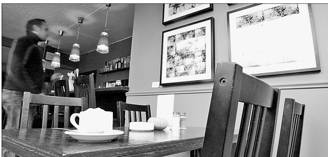
Le bistro Le Pimenté

Au bistrot Le Pimenté, en plein cœur du Plateau, on ne se prend pas au sérieux et c'est pour ça qu'on y est bien. D'abord la cuisine n'est pas pimentée, ensuite ce n'est pas exactement un bistrot, et enfin bien qu'on soit au cœur du quartier le plus franco-français de la ville, on propose ici des spécialités libanaises. Et pour couronner le tout, le patron a l'accent de l'avenue du Mont-Royal Est!