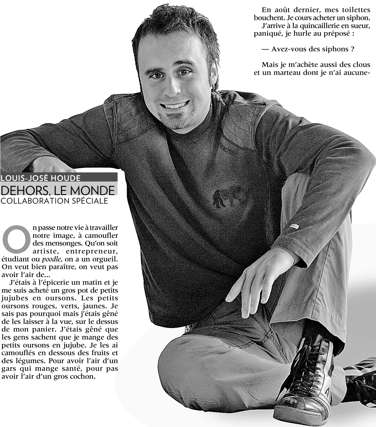
LOUIS-JOSÉ HOUDE DEHORS, LE MONDE COLLABORATION SPÉCIALE