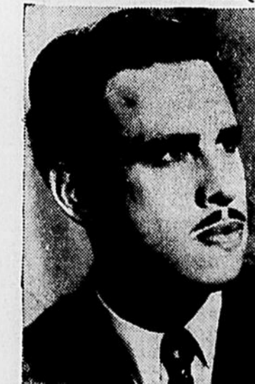
George London, basse-baryton originaire de Montréal, qui sera l'invité d'honneur à L'Heure Northern Electric le 16 février. Bien connu dans le monde de l'opéra aux Etats-Unis, sa voix lui a valu les plus élogieux commentaires de la presse américaine. Il interprétera un extrait du "Mariage de Figaro" de Mozart et "Ol' Man River" de Jerome Kern.

Le dernier à porter la parole sur cette question a été le T. H. M. King, qui a ainsi mis fin à un débat qui durait depuis plus d'une semaine et qui menaçait de s'éterniser, par suite des tactiques de l'opposition, que M. King a sévèrement critiquées.