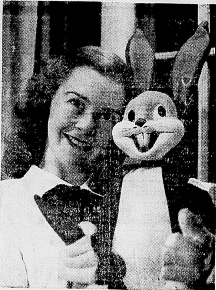
Reine de la mode, reine de la caméra, reine de l'athlétisme féminin pour la deuxième fois en trois ans, mais par-dessus tout, reine du patin, Barbara Ann Scott, charmante et fraîche dans toute sa jeunesse, nous apparaît ici dans un cadre bien familial. A la voir ainsi, on ne devinerait pas la fulgurante virtuose qui apparaît dans le documentaire de l'Office National du Film: L'ECOLE DES CHAMPIONS, de la série En Avant Canada.