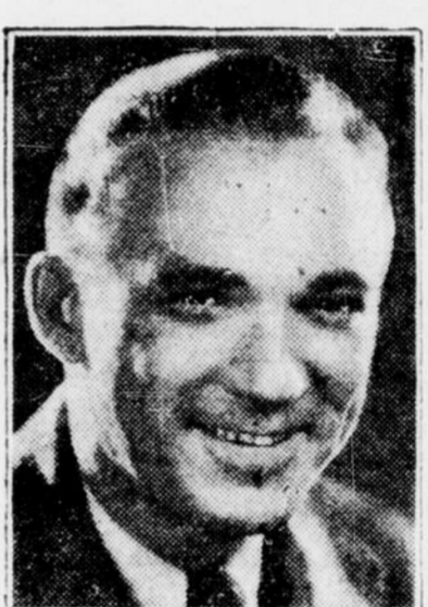
LEE TRACY qui vous verra au Théâtre Rideau, samedi et lundi dans "Clear All Wires."