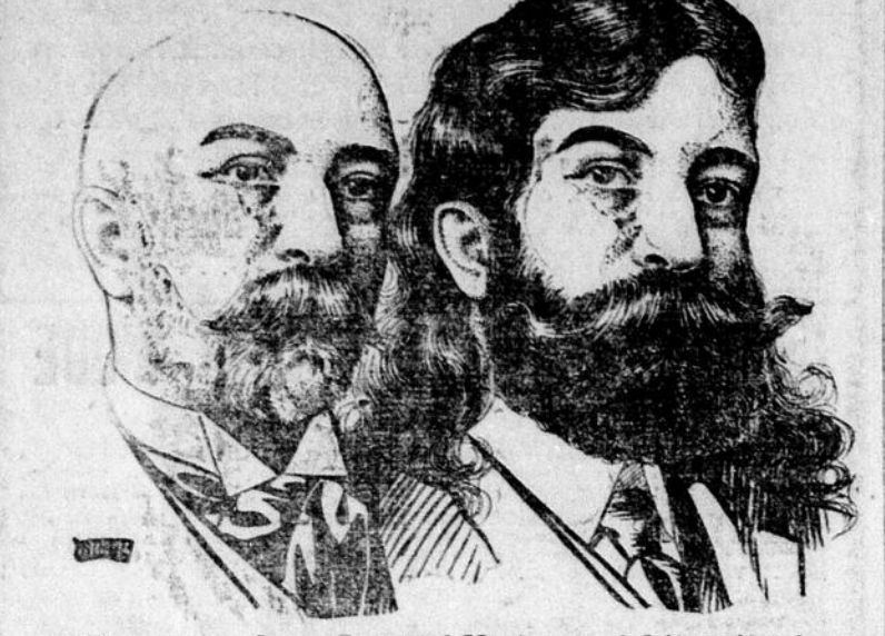
Le Découvreur de ce Composé Magique qui fait croître les cheveux en une seule nuit.

Envoie, droits payés, des Paquets d'essais Gratuits à tous ceux qui écrivent