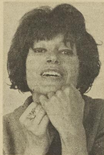
PAULINE JULIEN, qui a remporté le deuxième prix du Festival de Sopot en Pologne, présentera une partie de ce festival à l'émission radiophonique Visite aux chansonniers , le samedi 31 octobre, à 11 heures du soir, au réseau français de Radio-Canada. Une autre tranche du Festival de Pologne vous sera offerte, le samedi 7 novembre, à la même heure.

• Qu'au début de la soirée de mercredi soir, vers 7h. 30 p.m., un individu apparemment en boisson a poignardé un jeune garçon, devant une vingtaine de compagnons et compagnes réunis dans le Quartier Sud. Frappée en pleine poitrine, la victime de l'attentat s'en serait tirée cependant sans blessures trop graves, du fait que la lame du couteau à patates, dont s'est servi l'agresseur, a dévié sur une côte du jeune garçon et s'est crochie. Inutile d'ajouter que l'individu en question réfléchit "à l'ombre" sur les suites éventuelles d'un geste, qu'il ne s'explique pas lui-même.