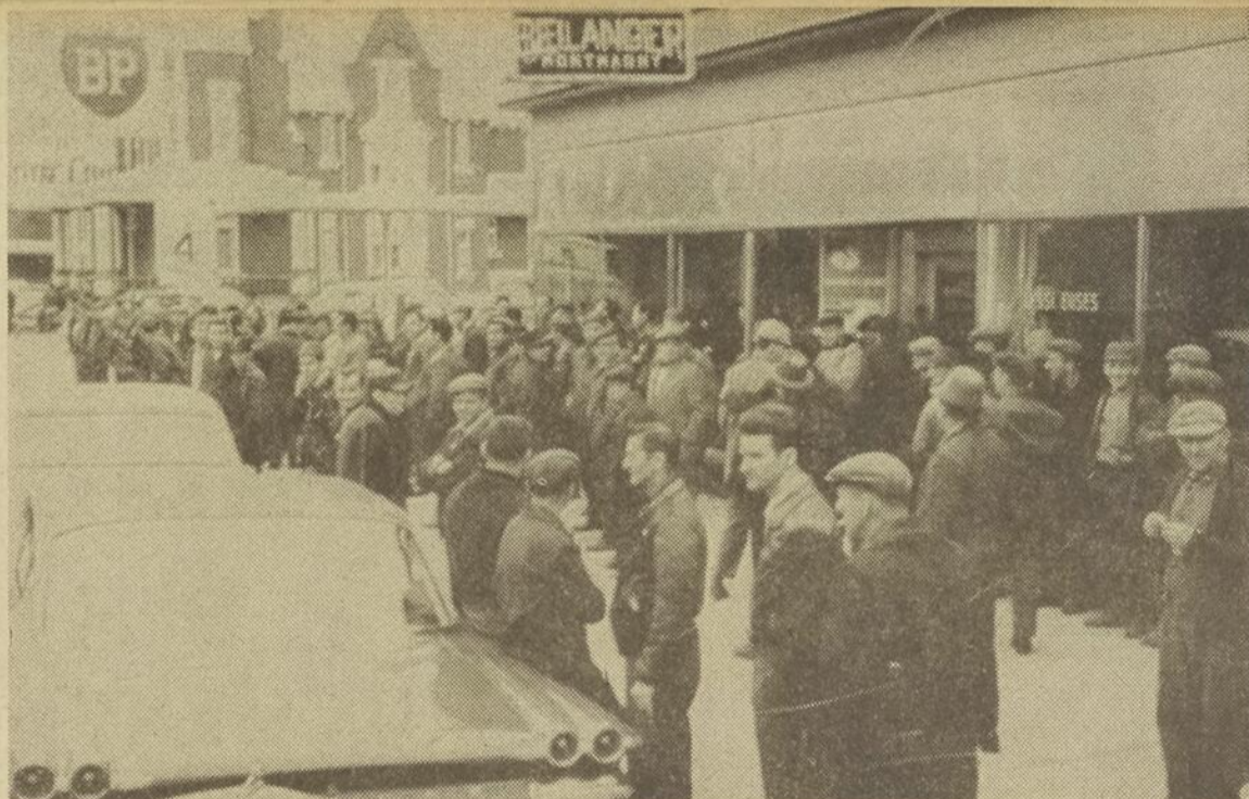
Dans un calme parfait, les employés de A. Bélanger Ltée attendent suite à leur réclamation devant les bureaux de la Compagnie.

Le président du syndicat ajoutait que leur mandat les amènerait cependant à s'occuper du litige, mais qu'aucune déclaration officielle ne pouvait être avancée avant d'avoir consulté les employés et la compagnie. Il tenait par ailleurs à bien préciser (Suite à la page 5)