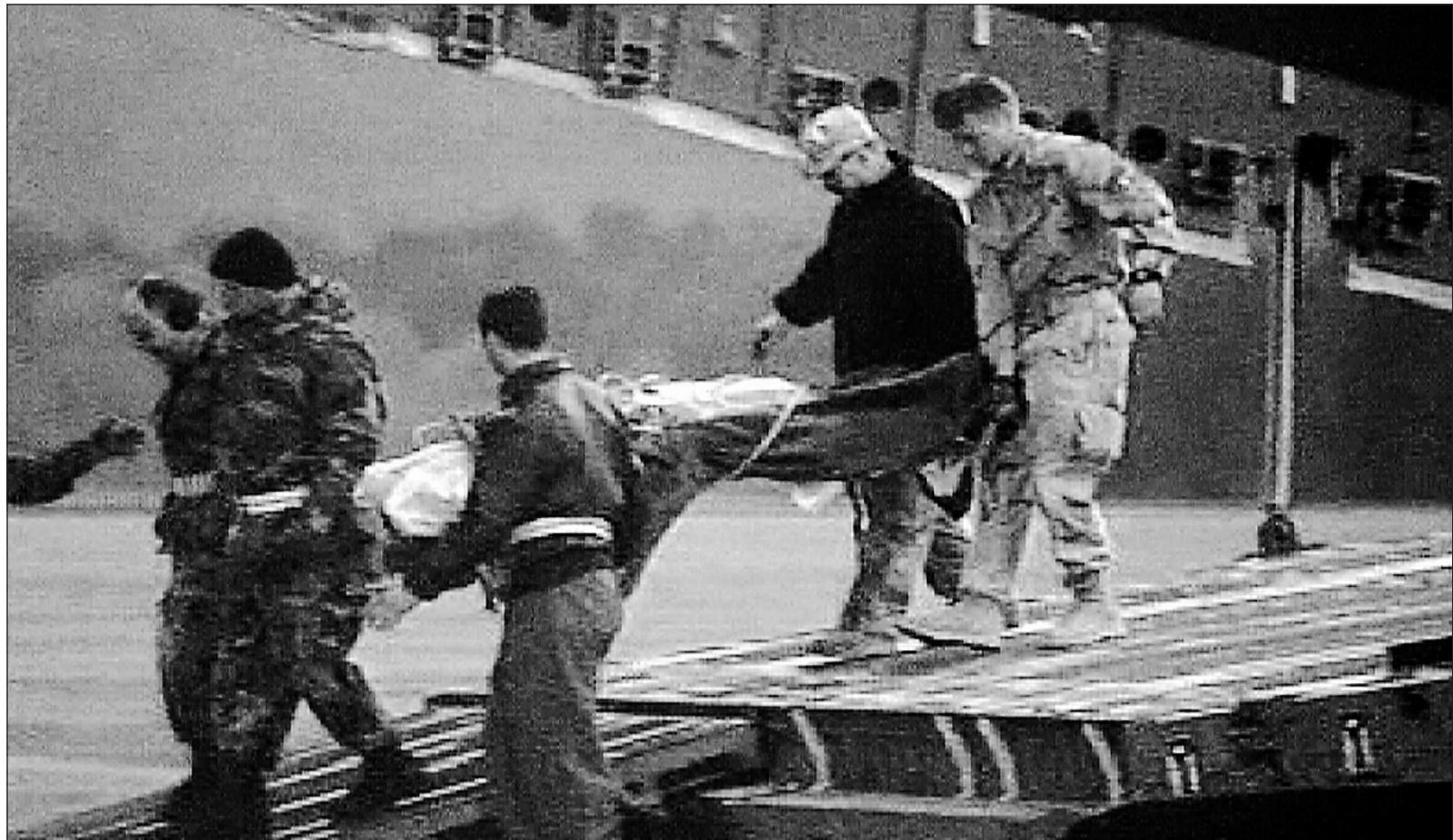
Un soldat blessé lors de l'attaque de dimanche dernier, en Irak, recevra des soins dans un hôpital allemand non loin de la base aérienne de Ramsteid.

La SQ devrait surveiller de très près les têtes chaudes qui essaient d'utiliser la question des défusions pour ramener les Montréalais à l'horrible époque du terrorisme politico-psychotique.