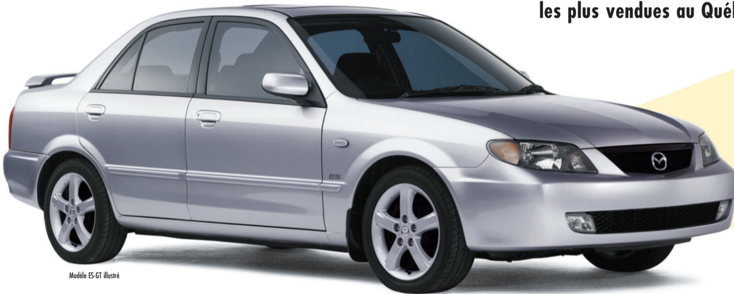
Modèle ES-GT illustré

Les Protégé et Protégé5, les plus vendues au Québec depuis 2 ans. 3