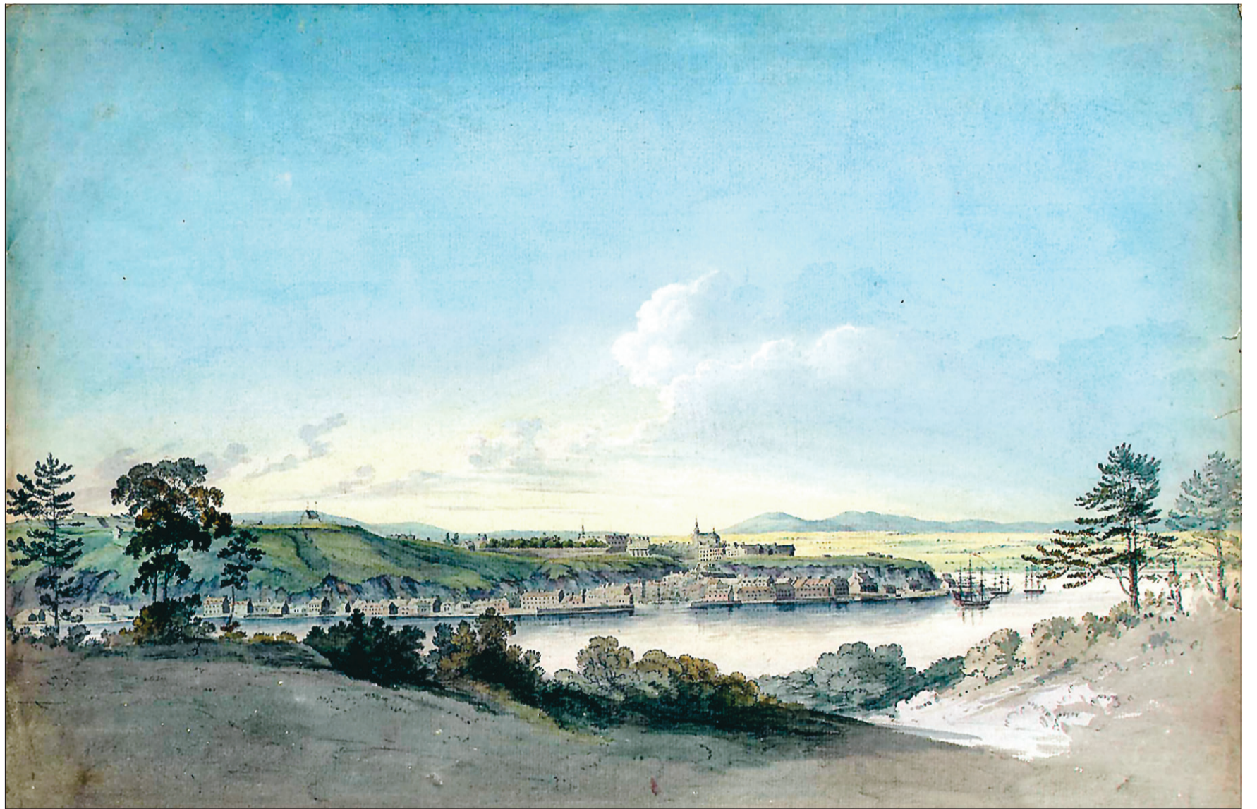
Une collection rare de 12 aquarelles de paysages canadiens, découverte dans le sous-sol de l'Université Oxford, en Angleterre, a été retirée de la vente aux enchères, hier, et achetée par les Archives nationales du Canada et le Musée des beaux-arts du Québec. Ces aquarelles, réalisées par Benjamin Fisher, un officier de l'armée britannique à la fin du XVIII e siècle, demeureront du domaine public. « Ces œuvres sont parmi les premières représentations de Québec, de Montréal et d'autres parties de l'est du Canada », a affirmé Ian Wilson, archiviste national pour Bibliothèques et Archives du Canada. La maison d'encan Bonhams, qui a négocié le prix de vente, a estimé leur valeur à quelque 200 000 $ CAN. Ci-dessus, une oeuvre illustrant Point Lévis.