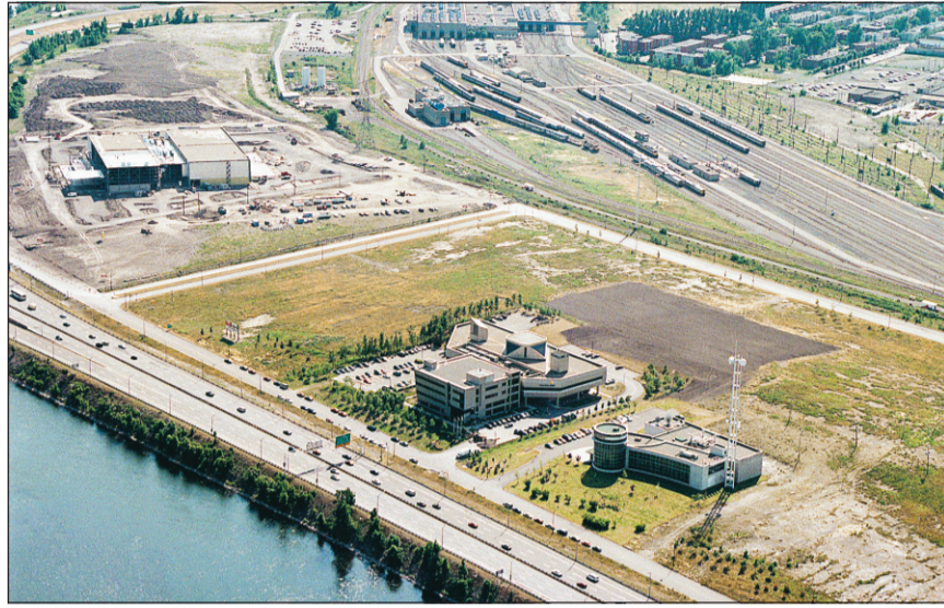
La moitié des prélèvements effectués au cours d'une analyse récente ont révélé une certaine toxicité de l'eau qui se déverse du Technoparc dans le Saint-Laurent.

Cette décision fait suite à l'analyse par les autorités fédérales des échantillons d'eau faite sur les lieux au cours des derniers mois. La moitié des prélèvements ont révélé une certaine toxicité de l'eau qui se déverse du Technoparc dans le Saint-Laurent. Cette pollution s'ajoute aux litres d'hydrocarbures et de BPC qui quittent annuellement ce terrain bordant l'autoroute Bonaventure