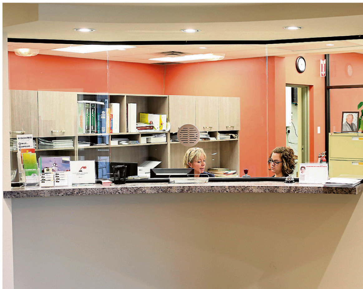
Le hall d'entrée de l'hôtel de ville a été revisité. Afin que l'endroit soit plus sécuritaire, des vitres de protection ont été ajoutées à l'accueil.