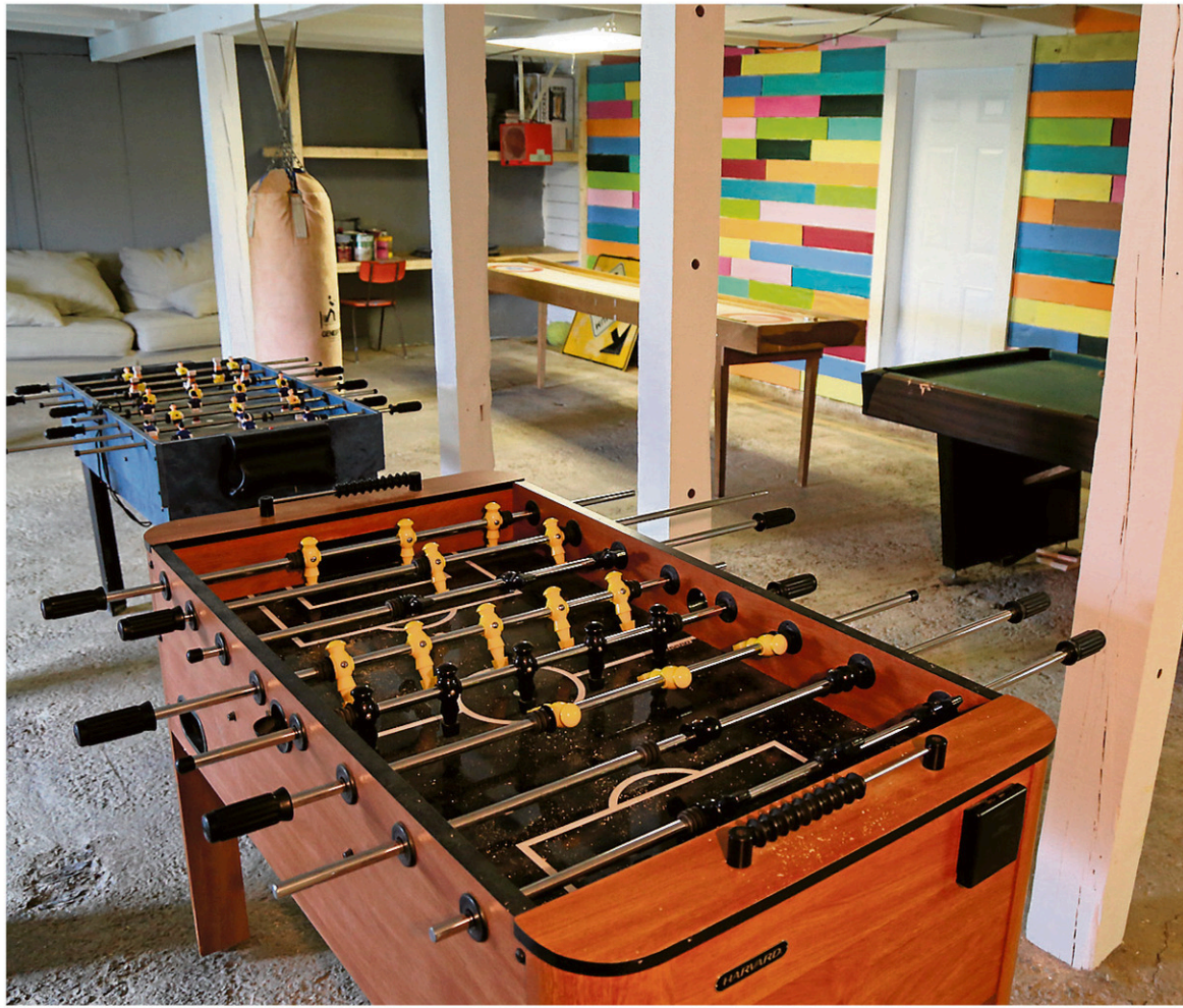
La popularité du Chalet est telle qu'une ancienne écurie, située juste à côté de la maison, a été transformée en aire de jeux pour les adolescents.