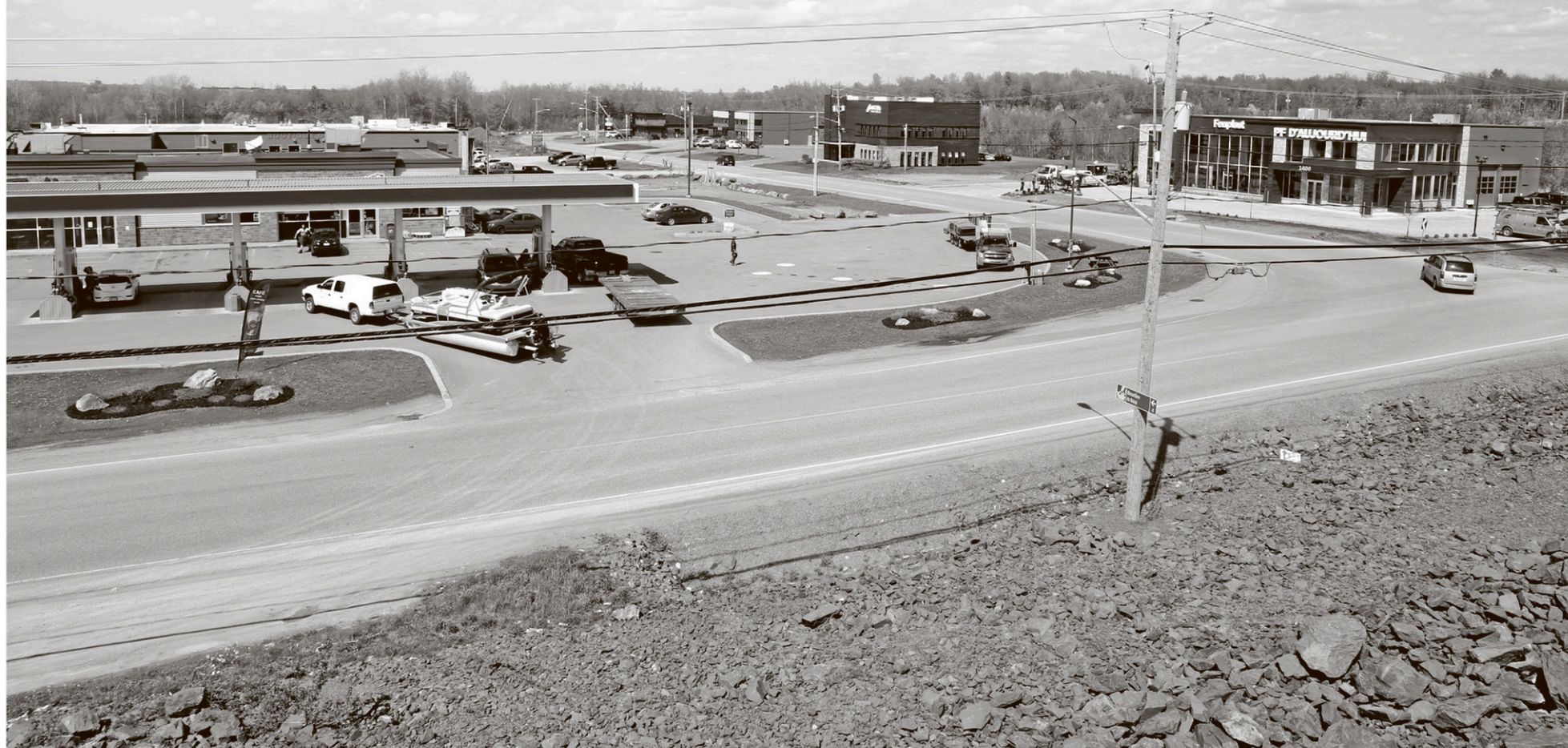
Les projets ne manquent pas au sein du parc industriel de Saint-Alphonse.