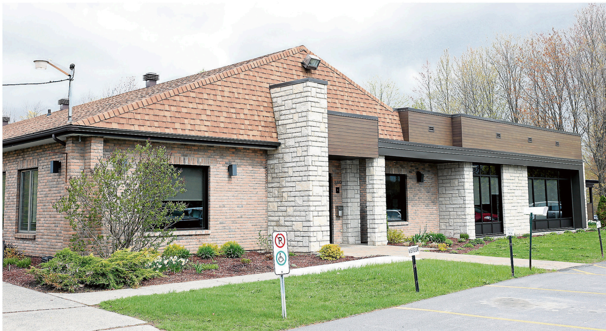
Un peu plus de 410 000 $ ont été investis pour agrandir l'hôtel de ville de Saint-Alphonse depuis deux ans.