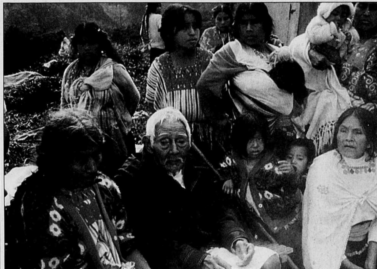
À Chenalhó, dans la communauté de Polhó, au Chiapas, cette famille d'Indiens tzotziles (la photo a été prise en février 1998) partage le sort de dizaines de milliers de personnes déplacées. Cet État fait l'objet d'une militarisation croissante et plusieurs leaders indigènes estiment qu'il y a « occupation » de leur territoire.