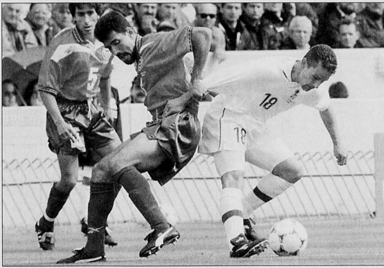
Plus vite qu'il n'en faut pour crier gare, Roberto Baggio s'est échappé pour décocher une attaque italienne.

En première période, après le but de Vieri (10 e ) sur un service de Roberto Baggio — une entame réussie pour deux joueurs qui évoluaient pour la première fois ensemble en sélection —, les vice-champions du