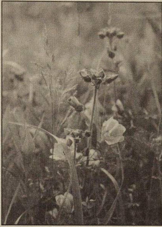
La Mauve musquée fait partie de la famille des Malvacées.

La Mauve musquée est une fleur que l'on n'oublie pas une fois que l'on a pris le temps de l'observer. Personnellement, des amis m'ont déjà apporté des tiges de cette plante à