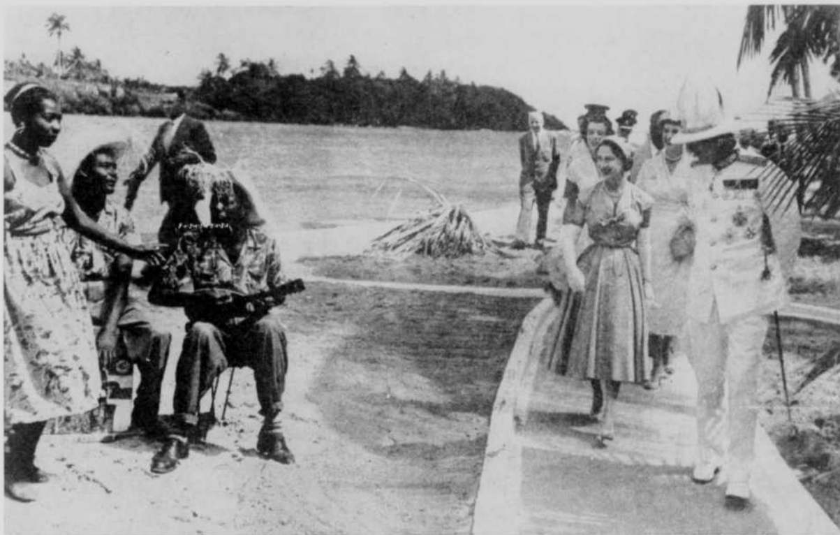
Le voyage que Son Altesse Royale la princesse Margaret effectuera bientôt au Canada sera l'un des plus longs et des plus importants qu'elle ait faits dans l'un des pays du Commonwealth. La charmante ambassadrice de la famille royale, que l'on voit ici lors d'une tournée à la Jamaïque, assistera à de nombreuses réceptions données en son honneur, durant son séjour au Canada. Dans la province de Québec, elle visitera notamment Montréal, Québec et Hull.

De l'aéroport de Victoria, des commentateurs relateront, à l'intention du public de la radio et de la télévision, les