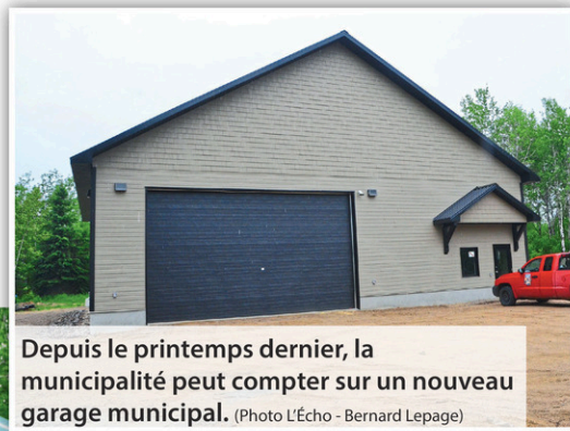
Depuis le printemps dernier, la municipalité peut compter sur un nouveau garage municipal.

« Avec notre camion à neige, nous n'avons que 1,8 km de rues à déneiger dans le village en hiver, mais nous assurons aussi le service aux résidents de deux baies en les facturant. » Enfin, un petit pavillon sera construit près de l'ancien garage municipal, à côté des bureaux municipaux, pour les utilisateurs de la patinoire.