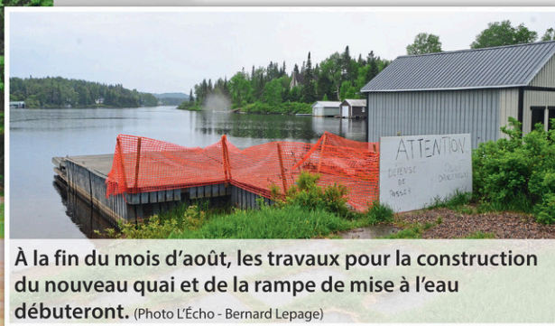
À la fin du mois d'août, les travaux pour la construction du nouveau quai et de la rampe de mise à l'eau débuteront.