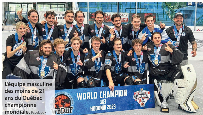
L'équipe masculine des moins de 21 ans du Québec championne mondiale.

Quand une personne que l'on aime s'envole... Une partie d'elle reste liée à notre cœur!