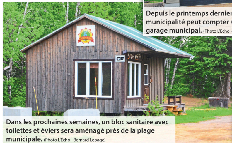
Dans les prochaines semaines, un bloc sanitaire avec toilettes et éviers sera aménagé près de la plage municipale.

D'une superficie de 1000 kilomètres carrés et comptant plus de 300 lacs, Lac-Édouard est une municipalité de près de 200 résidents, près d'un millier en comptant les villégiateurs. Près de deux cents chalets sont construits sur les 120 kilomètres de rives bordant le lac Édouard, long de 26 kilomètres. « Quand je suis arrivé ici vers la fin des années 1990, la richesse foncière était d'environ 6 millions $ alors qu'elle s'établissait à plus de 70 millions $ », termine le maire Larry Bernier, élu sans interruption depuis 2005.