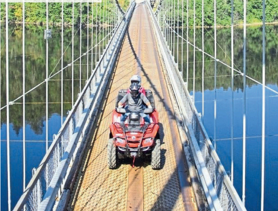
Le pont de la rive ouest du St-Maurice à La Tuque.

puisque qu'un camion du Service incendie de La Tuque peut traverser le pont en tout temps alors que les travailleurs du chantier seront avisés de cesser les travaux s'il y a une urgence.