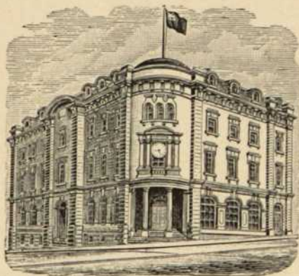
A. G. G. G.