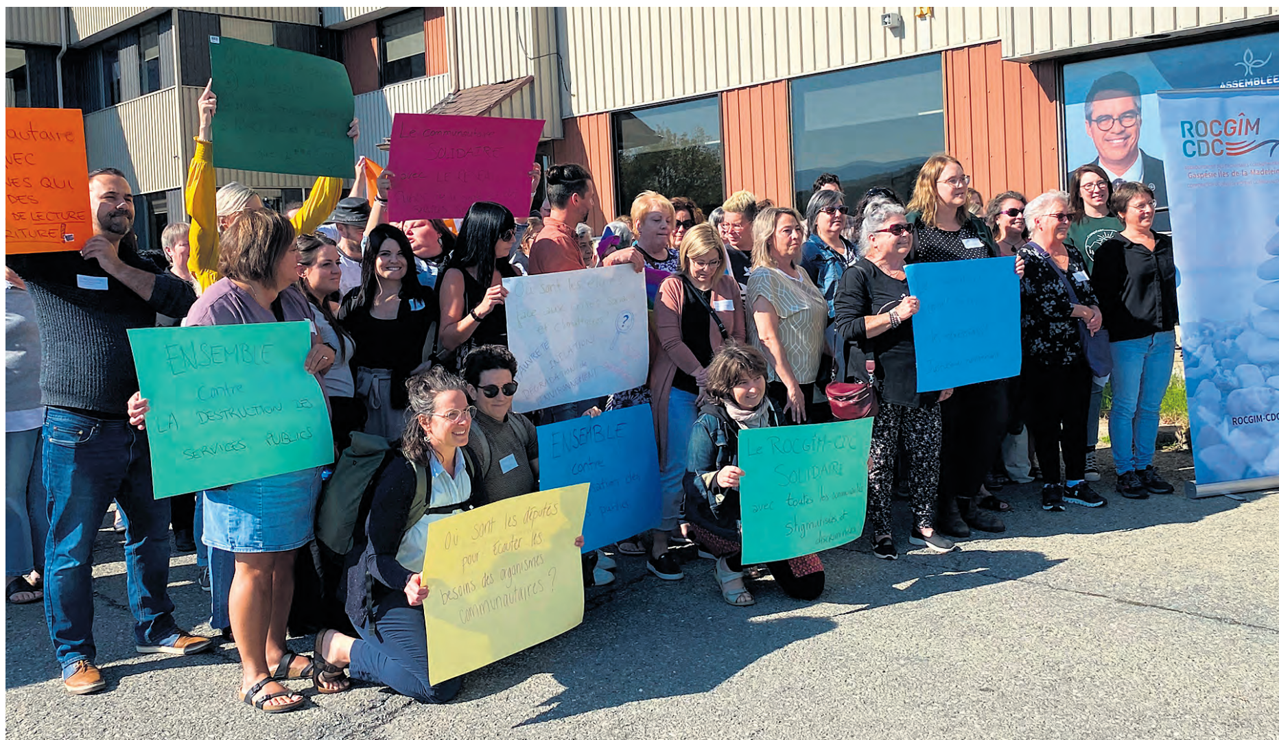
Une manifestation comprenant près d'une centaine de personnes s'est tenue jeudi midi devant les bureaux du député de Gaspé, Stéphane Sainte-Croix.