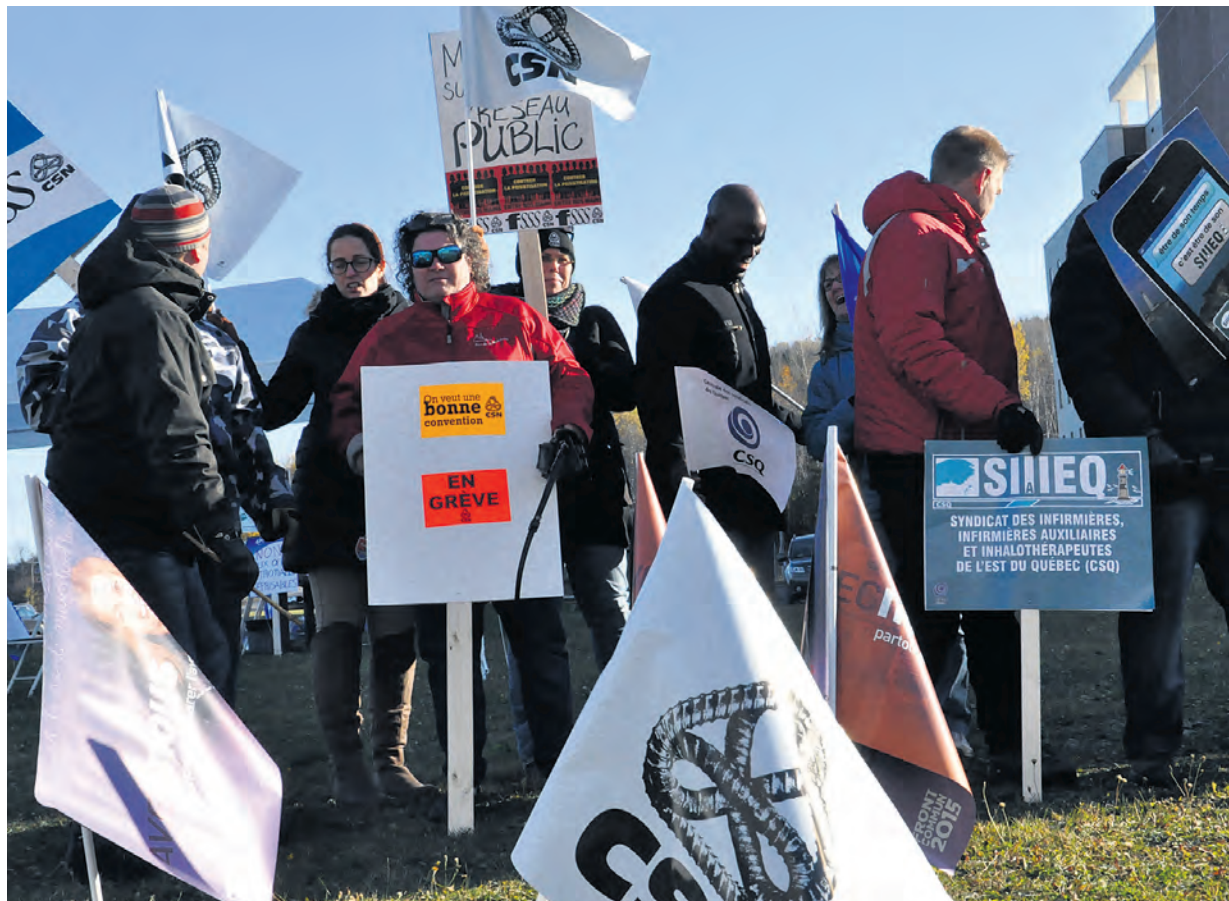
Le SIIIEQ représente 1070 infirmières, infirmières auxiliaires et inhalothérapeutes réparties sur le territoire de la Gaspésie.

Le SIIIEQ représente 1070 infirmières, infirmières auxiliaires et inhalothérapeutes réparties sur le territoire de la Gaspésie. Le syndicat veut que le gouvernement débloque