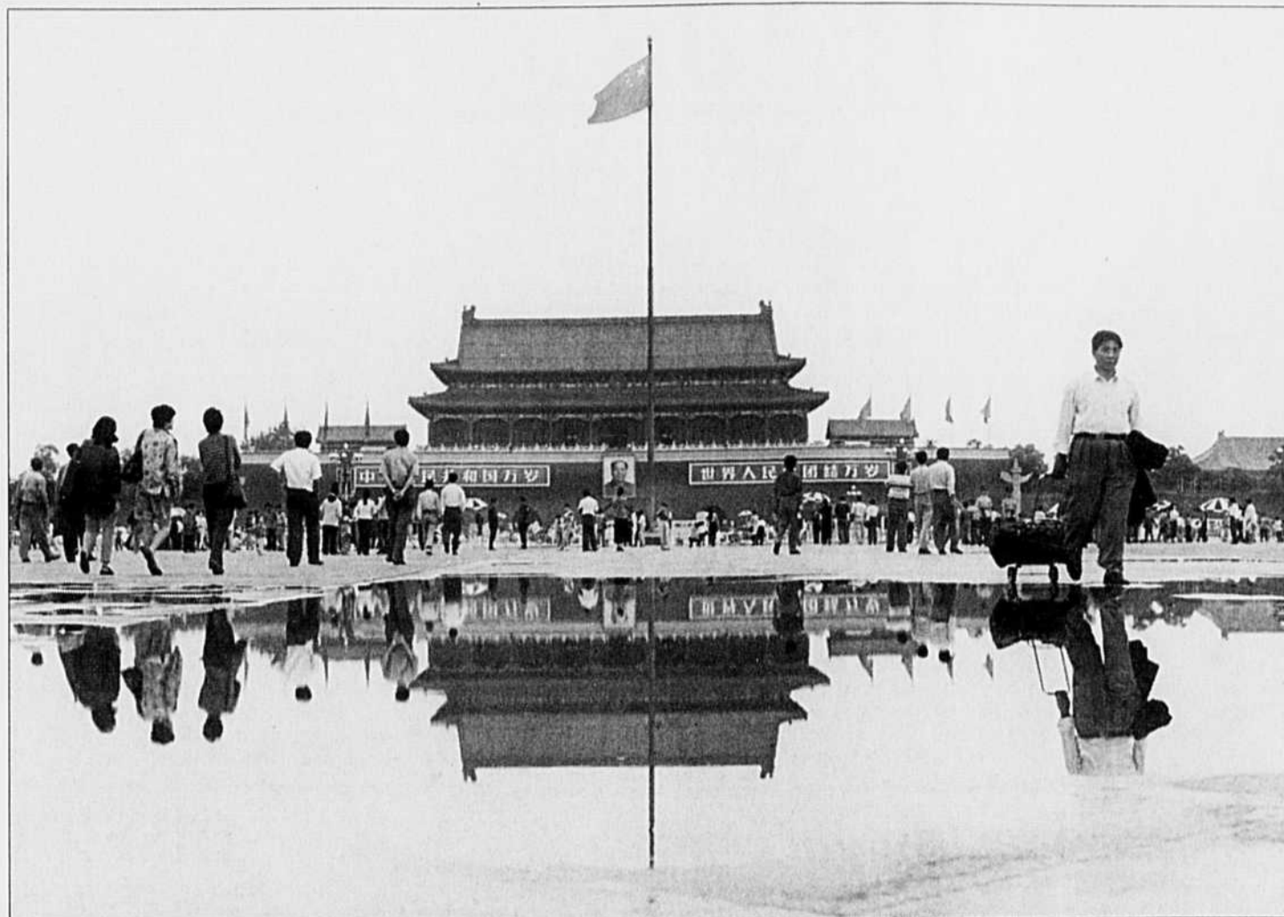
Au total, moins d'un être humain sur cinq vit dans un pays où les droits de l'homme n'ont pas fait de progrès ou se sont dégradés.