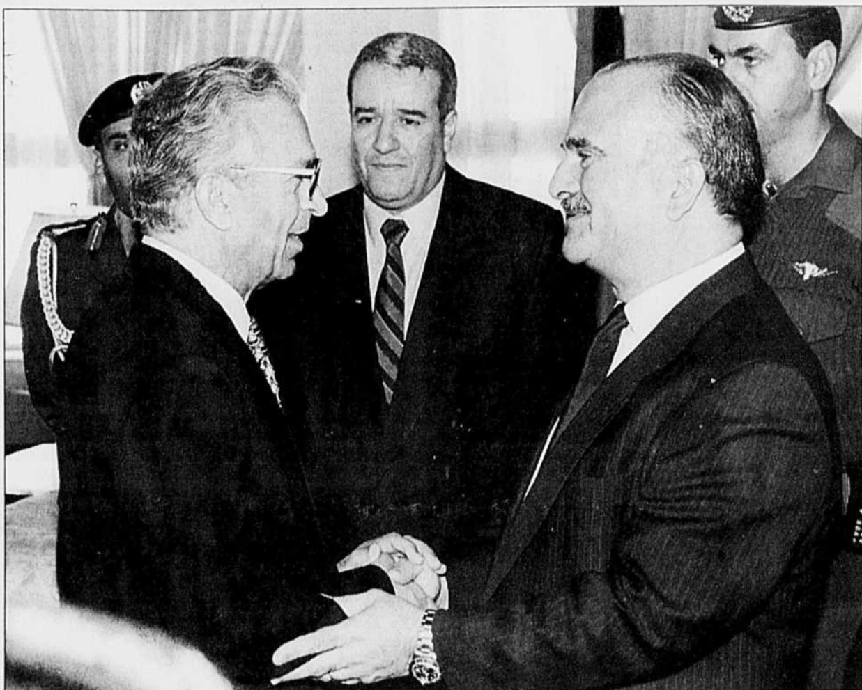
Hassan, le prince héritier de Jordanie, à droite, a reçu hier à Amman le président du parlement irakien, Saddoun Hamadi.

Face à ces défections et aux critiques sur son manque de crédibilité, M. Nétanyahou est cependant resté confiant. Il s'est déclaré certain d'emporter l'investiture du Likoud, puis de gagner les élections.