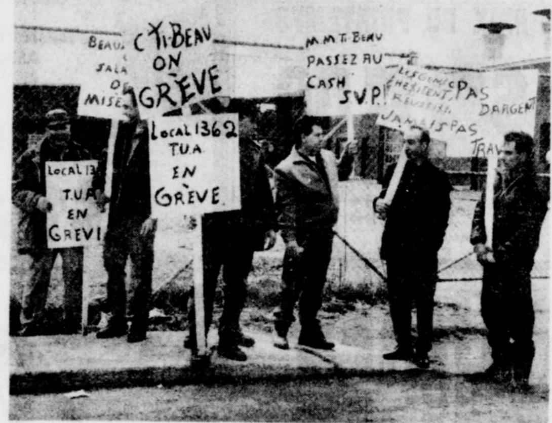
LA GREVE des syndiqués des Travailleurs unis de l'automobile se poursuit toujours à l'usine Pierre Thibeault Canada Ltée, à Pierreville. Les grévistes continuent à manifester leur mécontentement en arborant des pancartes qui décrivent bien leurs revendications.

Chanceux comme toujours, Montcalm (l'ami à moustache unique) a gagné une belle automobile lors d'un récent tirage. Il en est très fier car il avait l'idée d'en acheter une. La chance sourit à ceux qui sont patients. Pourtant, on ne peut pas dire qu'il en est ainsi pour le gagnant actuel.