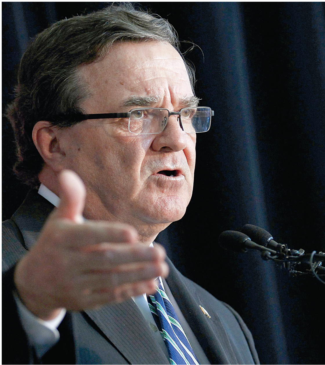
Le ministre des Finances, Jim Flaherty, juge non fiable et non crédible le rapport de Kevin Page, directeur parlementaire du budget.

Il y a deux semaines, en Suisse, le premier ministre Stephen Harper avait annoncé que le fédéral apporterait des changements au régime de retraite «afin d'en assurer la viabilité pour la prochaine génération». Or, voilà que le directeur parlementaire du budget vient de saper son argumentation. «Si le gouvernement décide de faire quelque chose, il doit trouver un autre argument, parce que l'argument de la viabilité, de la durabilité, franchement, n'existe pas», a dénoncé le chef intérim du Parti libéral, Bob Rae. L'une des options envisagées par les conservateurs serait de