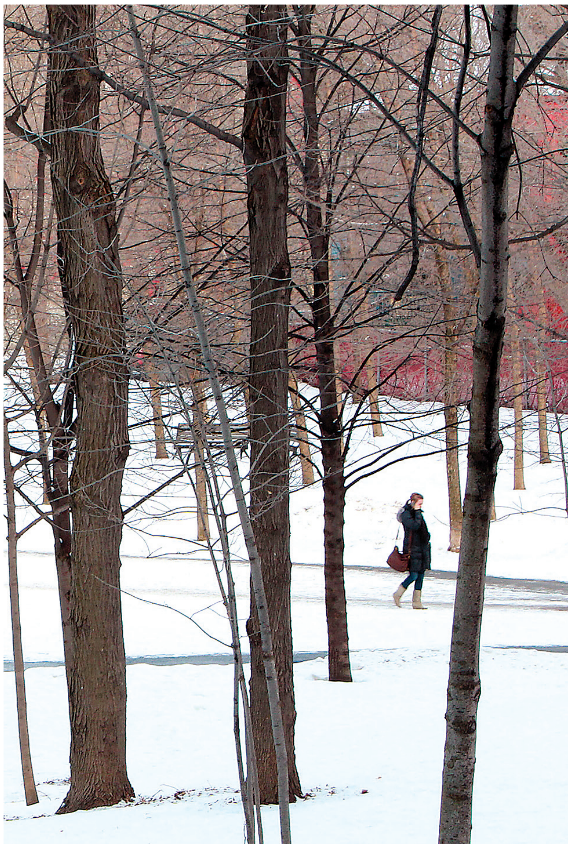
Le Québec peine — et c'est le cas en environnement — à se faire entendre sur la scène internationale.

Dans le système fédéral canadien, les progrès pour le Québec ne sont en effet plus possibles. Mes amis du Parti québécois et moi nous nous rejoignons sur les principes et la volonté que le Québec mette en œuvre sa propre politique étrangère. Nous nous rejoignons aussi sur le seul moyen possible: l'indépendance du Québec.