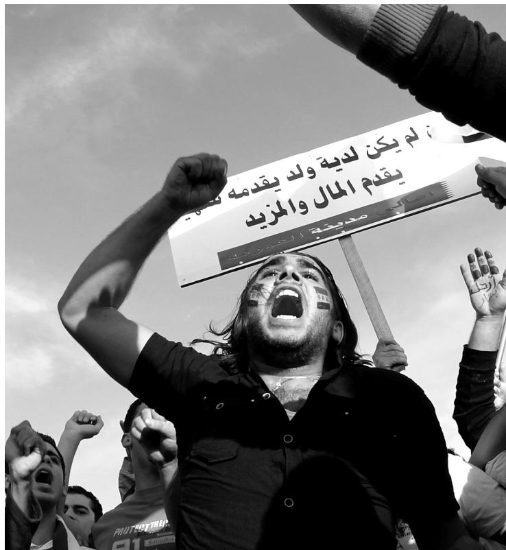
Des Syriens du Qatar ont manifesté leur soutien à leurs compatriotes hier.