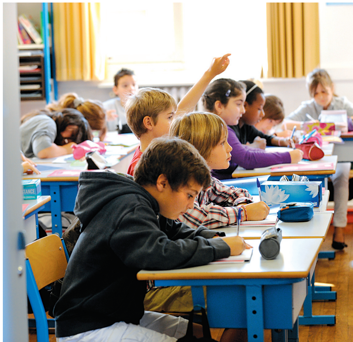
Le ministère de l'Éducation a demandé à ce que le programme d'anglais intensif soit implanté dans au moins une classe de 6 e année par commission scolaire pour la rentrée 2012.