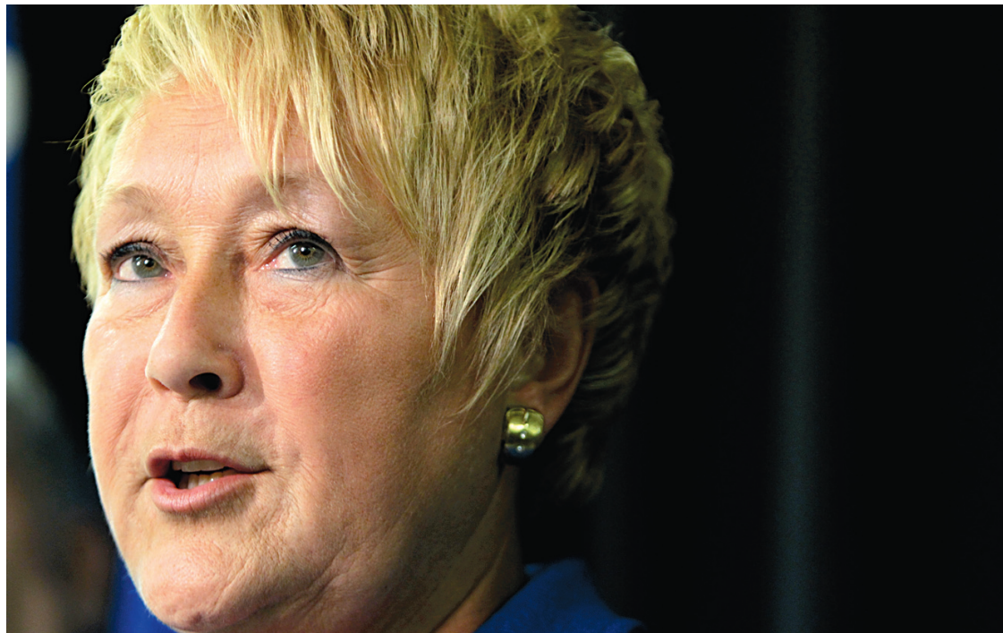
Pauline Marois a soutenu qu'avec son annonce d'hier, elle prenait «le parti de la classe moyenne et des familles québécoises».

Québec — Plusieurs y verront la première promesse électorale du Parti québécois. Si elle prend le pouvoir, Pauline Marois a annoncé hier qu'elle abolira la fameuse «contribution santé». Cette taxe de 200 $ par adulte a été instaurée par le gouvernement Charest en 2010 (elle était de 25 $ en 2010 et a été majorée progressivement à 200 $ cette année). Au dire de la chef péquiste, c'est «ce qui se fait de pire en matière de fiscalité» parce qu'elle est «injuste», «régressive» et «mauvaise pour l'économie». «Que vous gagniez 1 million ou que vous gagniez 15 000 $ [...] c'est toujours le même montant», a-t-elle déploré. Mais en l'abolissant, l'État se priverait de 950 millions annuellement. Le PQ propose de combler ce trou en haussant les impôts des Québécois les plus fortunés. Les contribuables qui gagnent entre 130 000 $ à 250 000 $ verraient leur taux d'imposition augmenter de quatre points de pourcentage, passant de 24 à 28 %. Au-delà de 250 000 $, il serait fixé à 31 %. «Il est grand temps, à mon avis, d'injecter plus de justice économique dans notre fiscalité», a déclaré le critique en matière de finances, Nicolas Marceau, qui accompagnait Mme Marois. L'opération se ferait donc à «coût nul», a insisté Mme Marois. Autre ponction chez les plus riches: un gouvernement du PQ réduirait