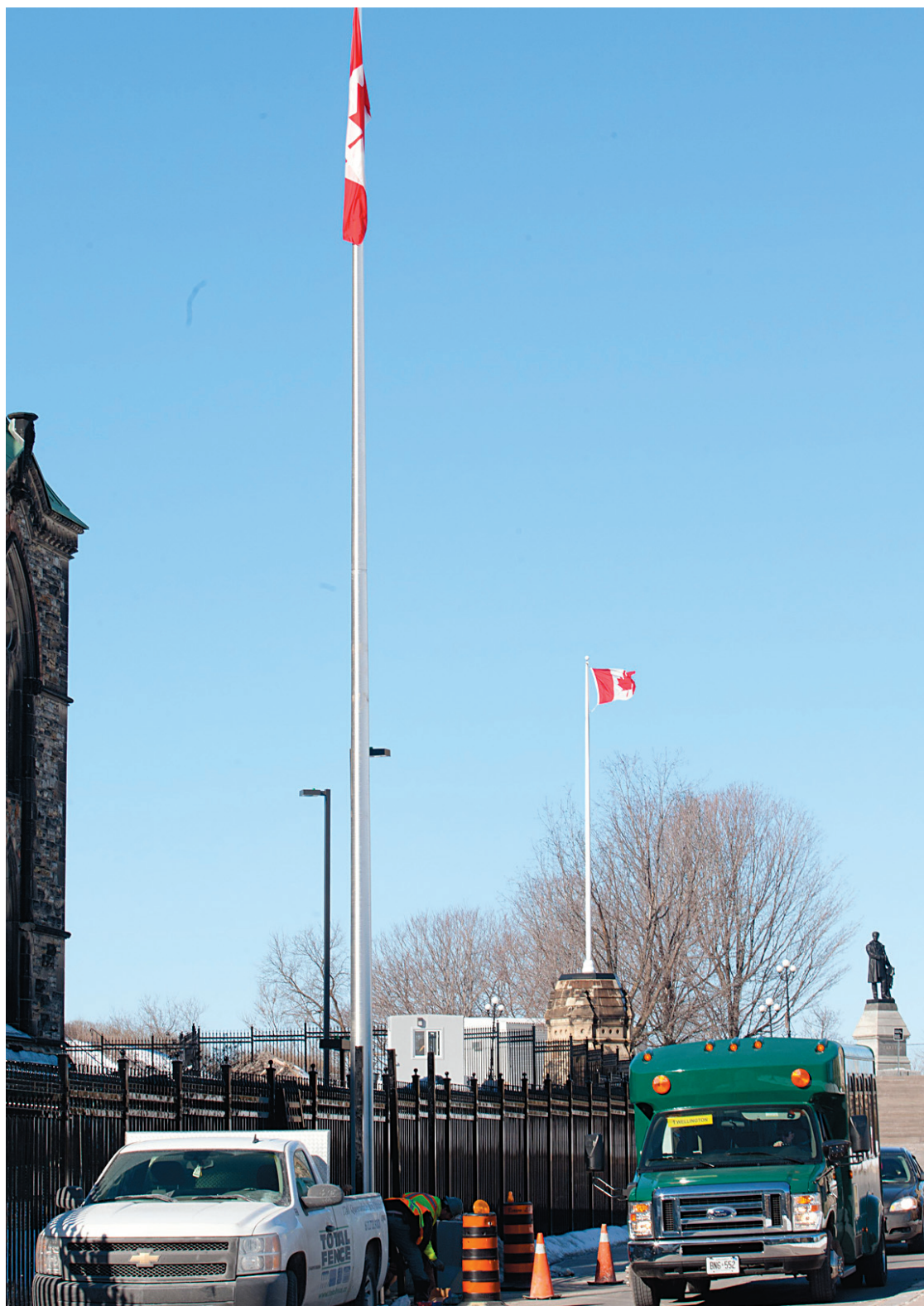
Le mât temporaire (à l'avant-plan) installé au coût de 25 000 $ est situé à environ 100 mètres d'un autre, permanent, déjà en place. Des travailleurs installaient hier l'extension de la clôture devant le protéger du trafic automobile.