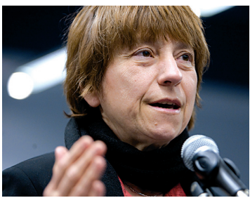
Françoise David