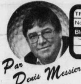
Par Denis Messier