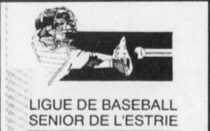
LIGUE DE BASEBALL SENIOR DE L'ESTRIE