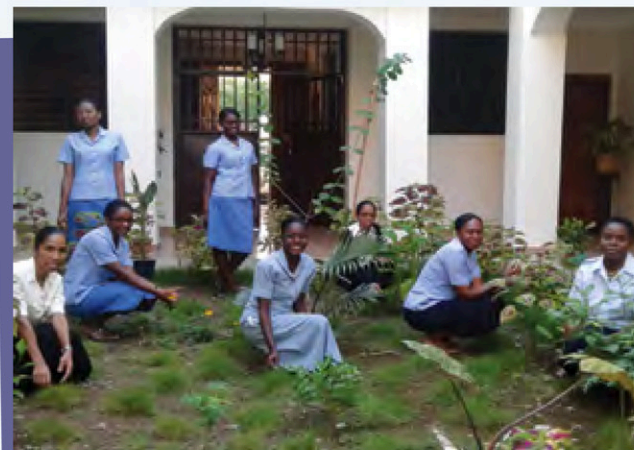
Les jeunes MIC en formation

Merci de collaborer à notre sécurité et à notre mission par votre générosité.