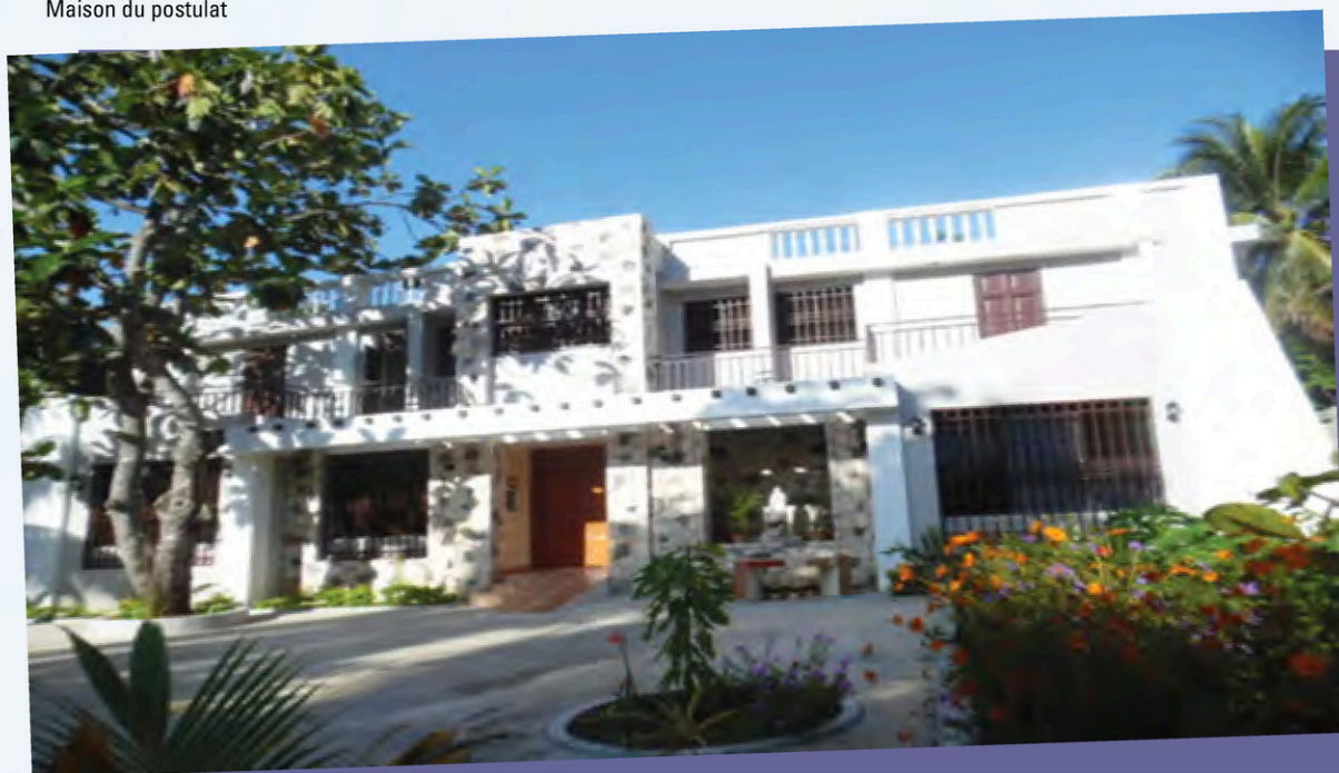
Maison du postulat

S. Carmèneta Beauplan, m.i.c. Responsable des jeunes en formation au Postulat