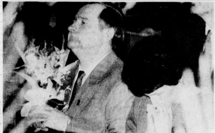
Lech Walesa est allé à la messe du Dimanche des Rameaux à Chicago, accompagné de son épouse, Danuta.