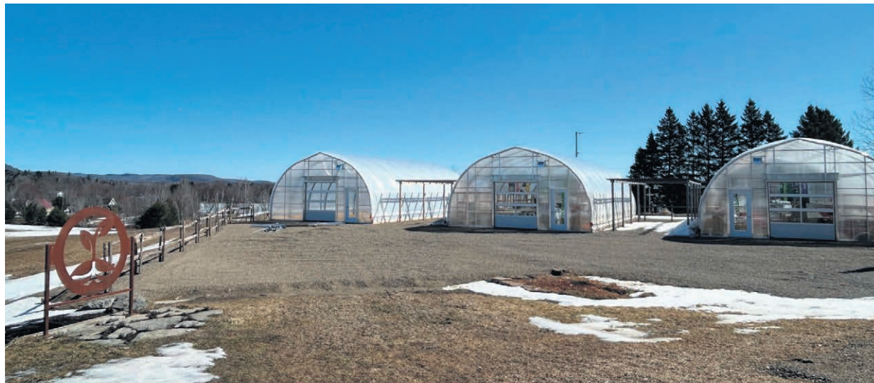
En cette quatrième saison qui débute pour la Fermette et Jardinerie Enracinés de Saint-Gabriel-de-Brandon, les propriétaires dévoilent l'agrandissement de leurs installations, représentant une nouvelle surface de près de 33 % supplémentaires.

Pour les personnes qui ne pourront assister à cet événement de lancement de saison, il sera possible,