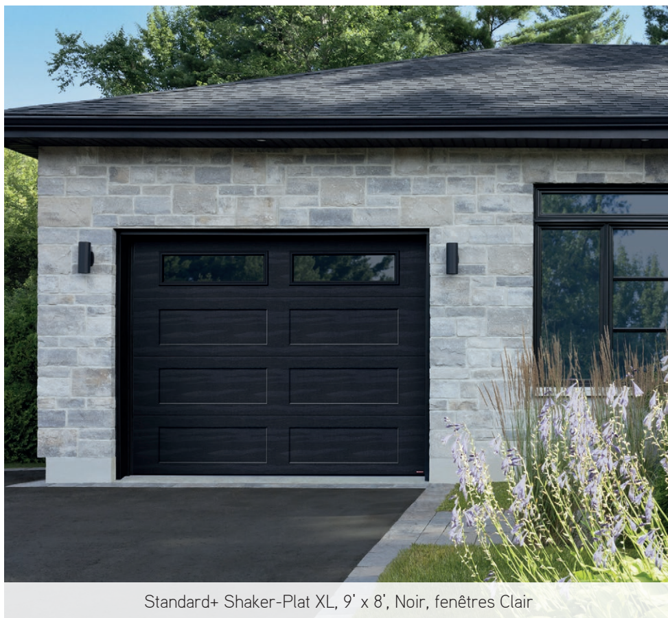
Standard+ Shaker-Plat XL, 9' x 8', Noir, fenêtres Clair

Pour votre porte de garage, faites affaire avec les vrais experts!