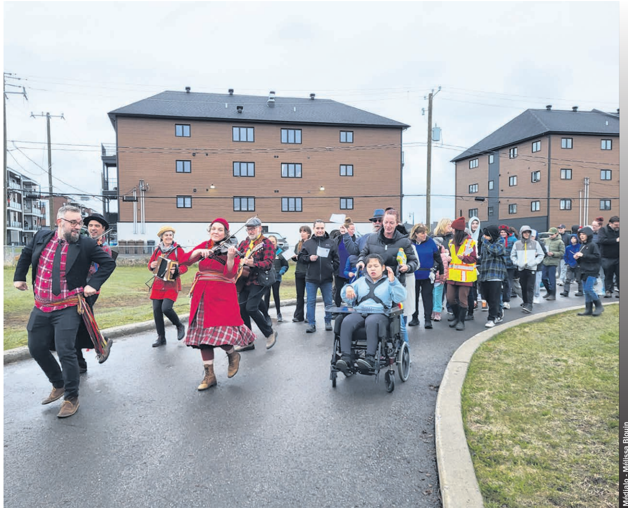
Pour une première fois, la marche s'est déroulée sur le terrain de l'école de l'Espace-Jeunesse.