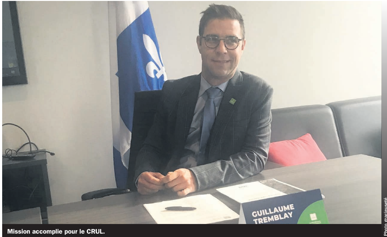
Mission accomplie pour le CRUL.

« Avec l'accroissement de l'offre universitaire, le CRUL laisse un legs important pour la région en matière d'accessibilité à l'enseignement supérieur. Je salue la contribution de tous ceux qui auront collaboré à soutenir la mission du CRUL au cours des dernières années. Maintenant, c'est un nouveau chapitre qui s'ouvre vers une concertation régionale encore plus forte en matière d'éducation », a affirmé Guillaume Tremblay, président du CRUL et maire de Mascouche.