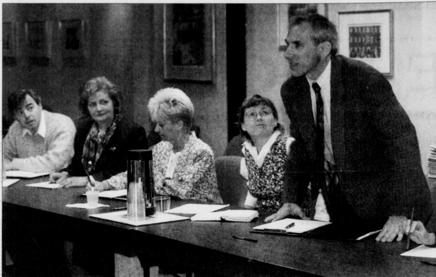
Une bonne douzaine d'employeurs se sont présentés, hier matin, à la clinique de formation qui leur était offerte par LE SOLEIL, en collaboration avec le FM 93. Axée sur le processus d'embauche, la clinique se proposait d'outiller convenablement les chefs d'entreprises, afin que soit toujours placée « la bonne personne au bon endroit ».