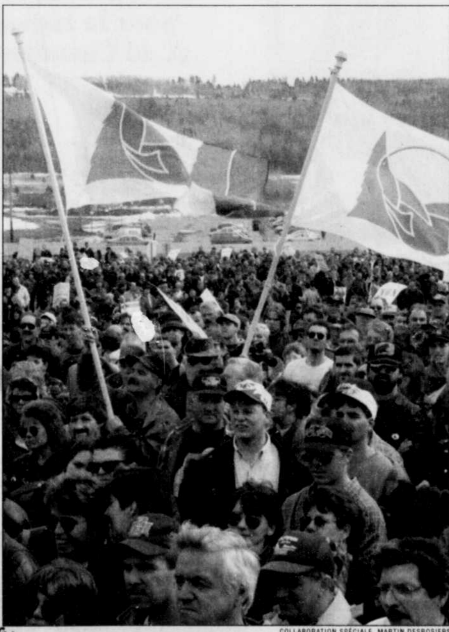
La manifestation a réuni quelque 5000 personnes, venues du Bas-Saint-Laurent, de la Gaspésie, de la Vallée de la Matapédia et du Nouveau-Brunswick.

Pour les protestataires en provenance de la péninsule gaspésienne, il s'agissait d'un trajet de sept heures en autobus. Une quarantaine de ces véhi-