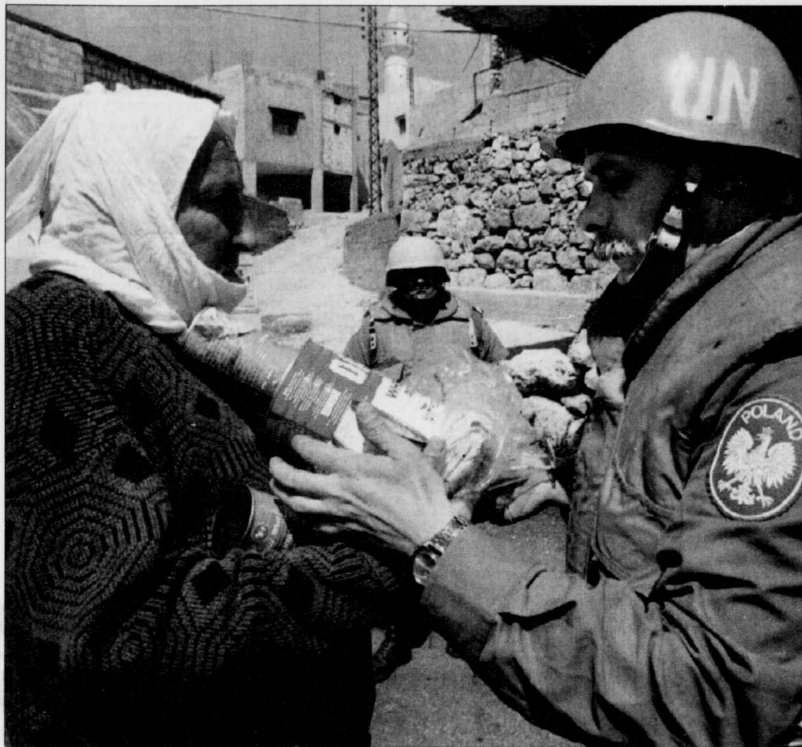
Pendant que les soldats de l'ONU distribuait des vivres aux civils libanais touchés par les combats, les tractations diplomatiques se poursuivaient, hier à Damas, en vue d'un cessez-le-feu entre le Hezbollah et Israël. L'artillerie lourde et l'aviation israéliennes ont néanmoins poursuivi les raids. Détails en page A8.