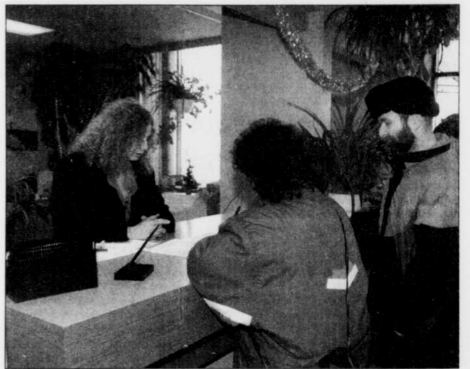
En décembre 1995, 626 citoyens de Val-Bélaire étaient venus signer le registre municipal pour marquer leur opposition au projet de complexe civique.

« Nous publions, dans l'édition courante du journal municipal l'Impact, le détail du projet et des étapes succes-