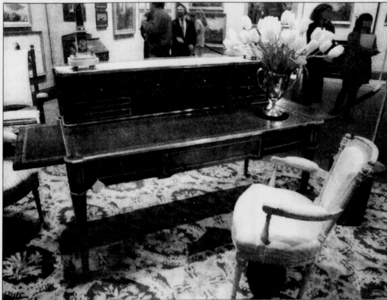
Le bureau de style Louis XVI sur lequel le Traité d'interdiction des essais nucléaires a été signé en 1963 par John Kennedy fait partie des objets qui vont être vendus aux enchères, mardi.

Selon Sotheby's, 80 % des personnes ayant manifesté leur désir de participer aux enchères sont des nouveaux venus dans les salles des ventes. Le résultat final est donc très difficile à prévoir et la maison de vente s'attend à des enchères très disputées et très longues.