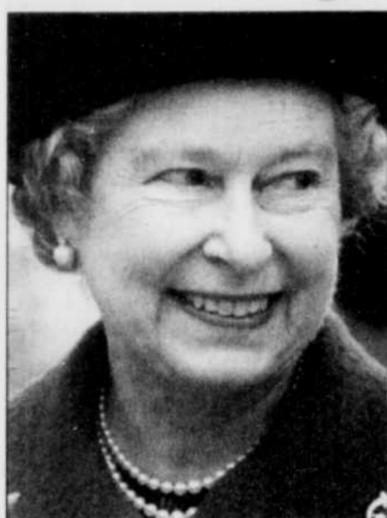
La reine Élisabeth II est peu affectée par la chute de popularité de la famille royale.

LONDRES (AFP) — La reine Élisabeth d'Angleterre a choisi de célébrer aujourd'hui sans faste ses 70 ans sur fond de critiques contre la monarchie secouée par les démêlés conjugaux de ses enfants Charles et Andrew.