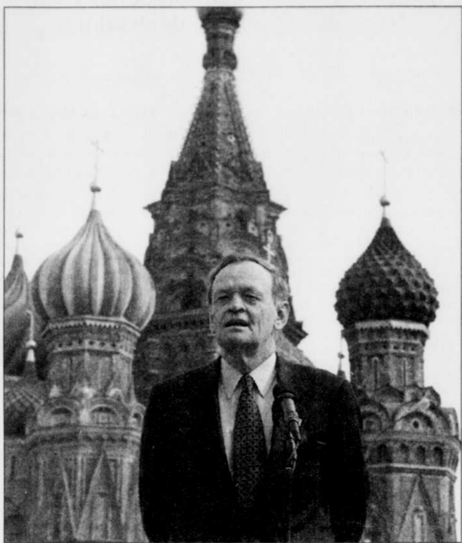
À la suite du Sommet sur la sécurité nucléaire, qui se tenait à Moscou cette semaine, le premier ministre canadien Jean Chrétien a tenu une conférence de presse devant la cathédrale Saint-Basile, sur la Place rouge.