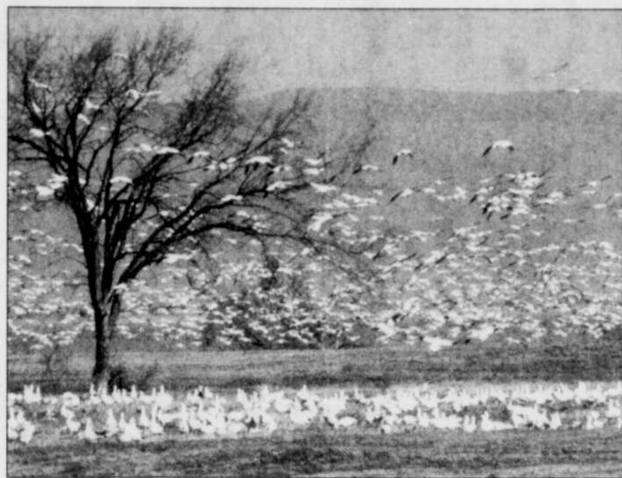
L'UQCN reconnaît que les inquiétudes des agriculteurs sont légitimes quant aux dommages causés par les oies blanches aux cultures.

Au SEPB-57, on pense que les travailleurs de la Caisse pop de Charny, qui se sont très majoritairement prononcés en faveur d'un syndicat, recevront leur certificat d'accréditation à l'été.