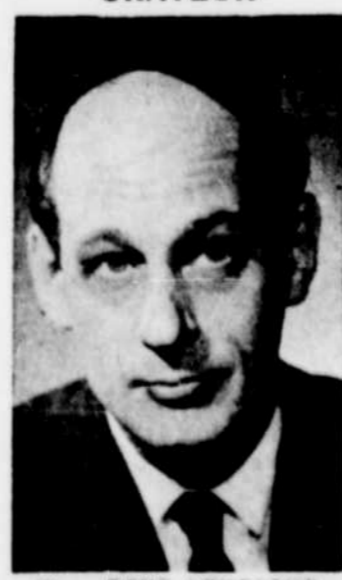
Hon. RENE LEVESQUE

INVITES: L'Honorable Jean Lesage sera accompagné dans notre ville par les ministres.