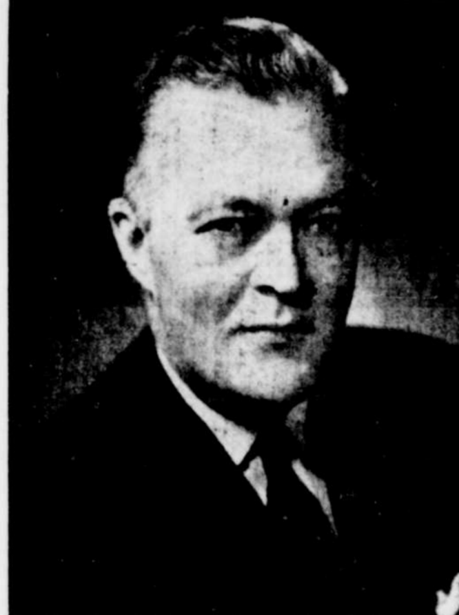
HONORABLE JEAN LESAGE

Le Petit Salon des Arts de Shawinigan aura sa saison artistique, samedi soir, le 6 octobre, au Casino Inn à 8 h 30. L'invité sera le poète-chansonnier connu, Claude Léveillé.