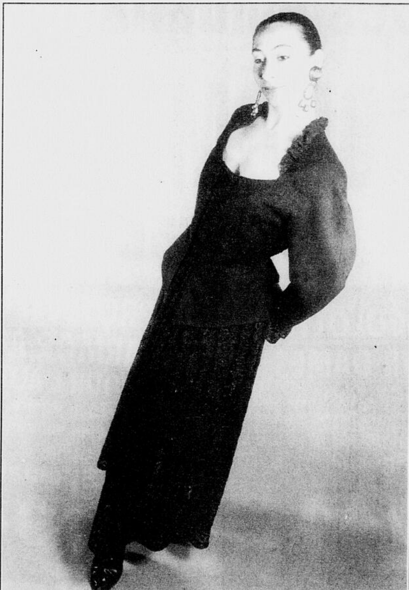
Tailleur deux-pièces au veston cintré à la taille, avec basque de gabardine de laine marine, surmontant une jupe paysanne de dentelle de coton également marine. Pour plus de féminité, des lacets se croisent au corsage.