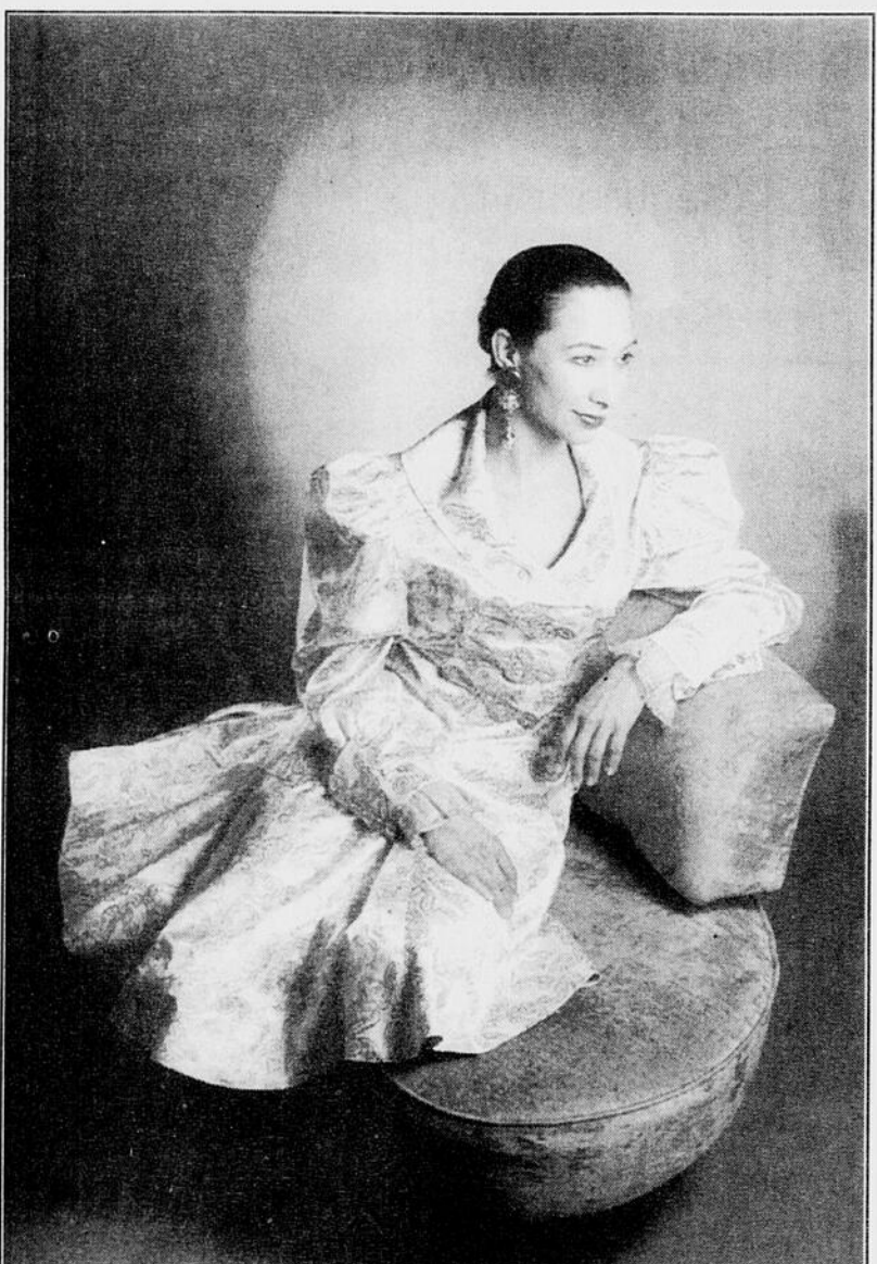
Redingote style Louis XV au corsage ajusté, manches gigot, jupe à godets asymétriques, taillée dans un poul de soie ivoire, imprimé de motifs gothiques dorés.