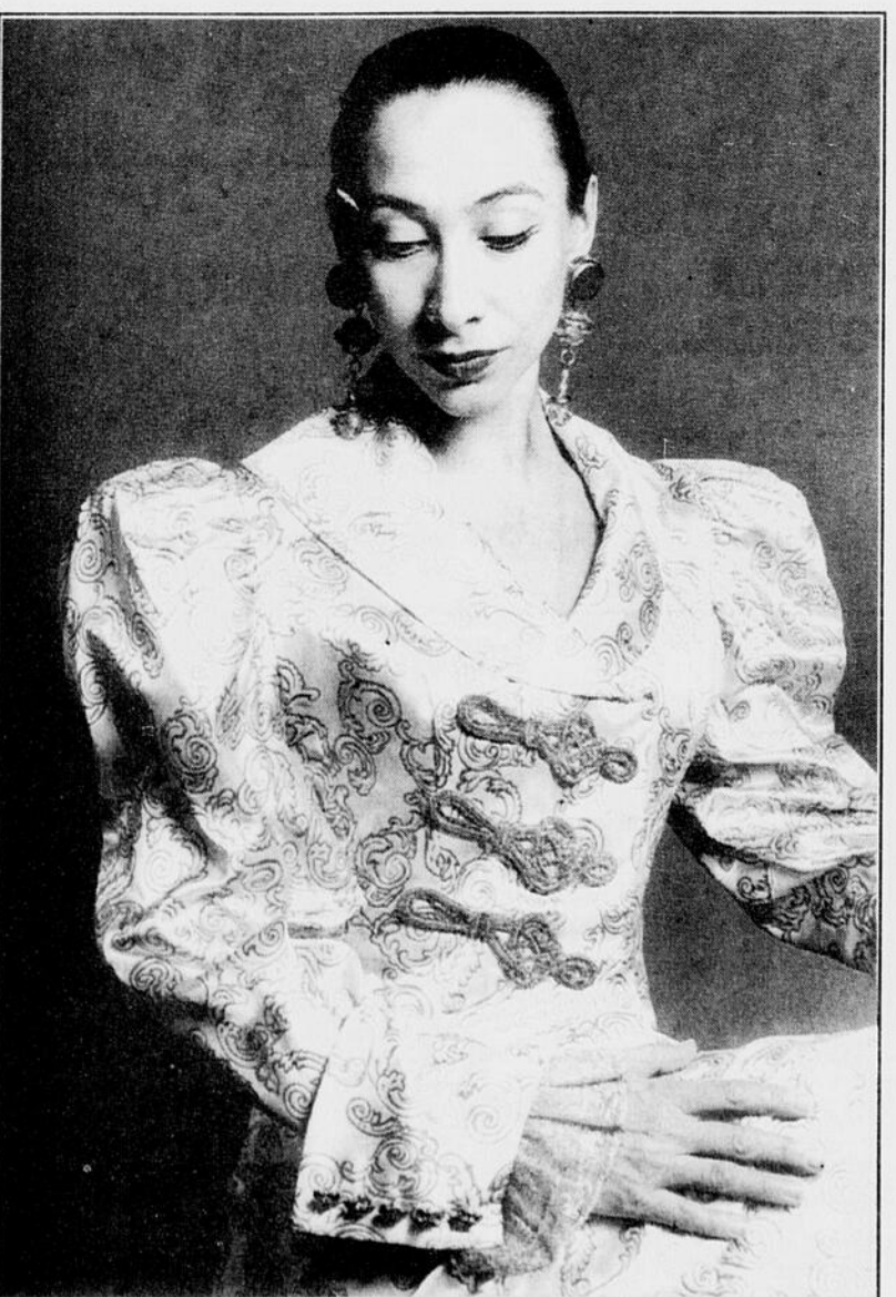
Détails du corsage de la redingote: larges revers aux manches et poignets de dentelle ainsi que des appliqués posés main au devant.