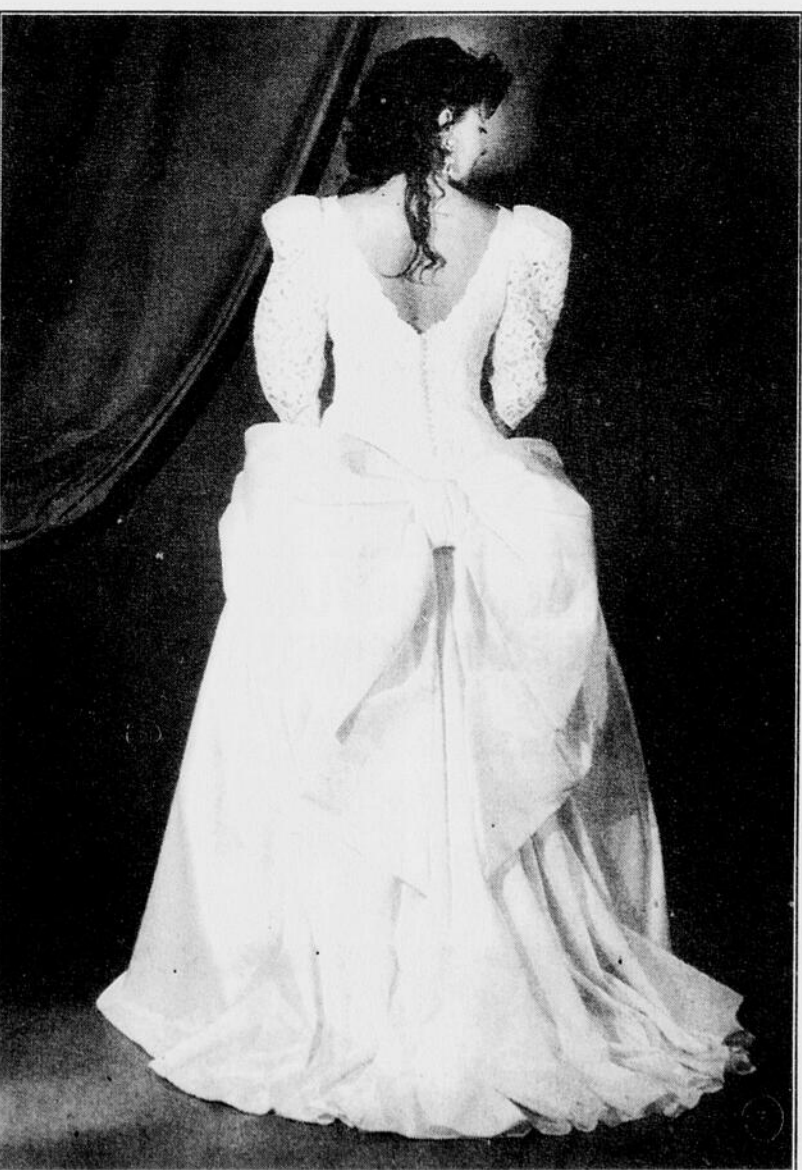
Une énorme boucle de taffetas au bas du dos caractérise cette robe de mariée taillée, pour la jupe dans un taffetas de soie. Le corsage, ajusté et à manches gigot, a préféré la guipure.