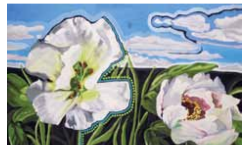
L'œuvre Les deux fleurs (2007), de l'artiste blainvilloise Sylvie Courchesne, a été acquise par la Municipalité en 2009.

Toujours soucieuse de promouvoir la richesse culturelle régionale, la Ville de Blainville est heureuse d'offrir la possibilité aux artistes en arts visuels d'exposer en solo, duo, trio ou en groupe (4 à 6 artistes) à la Galerie d'art.