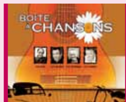
La Boîte à chansons 8 octobre, 20 h Théâtre Lionel-Groulx