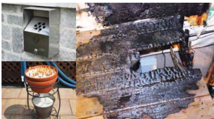
Photo de droite : vue d'un balcon endommagé par un incendie de cendrier qui n'était pas sur un socle de pierre.

Durant la période du 15 mai au 12 juin dernier, la cigarette a vraisemblablement été à l'origine de trois incendies majeurs de résidences unifamiliales sur le territoire de la Ville de Blainville.