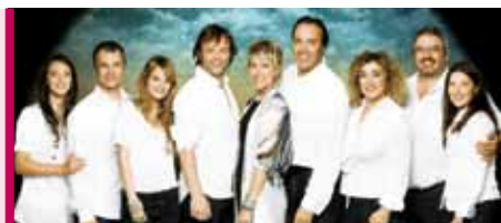
Les filles de Caleb 16 et 17 septembre, 20 h Théâtre Lionel-Groulx