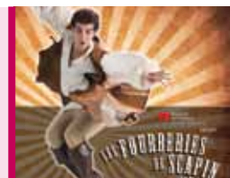
Les Fourberies de Scapin 6 et 7 octobre, 20 h Théâtre Lionel-Groulx