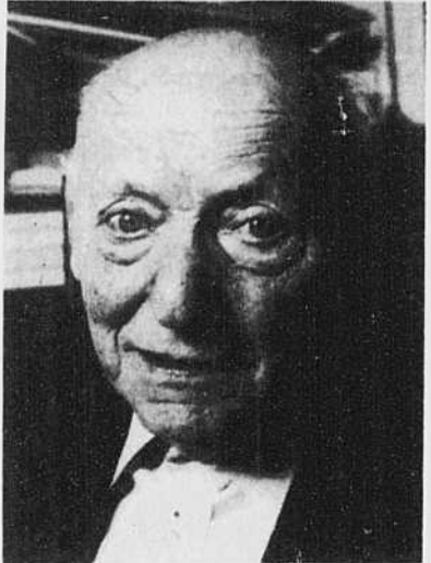
Isaac Bashevis Singer

ture 1976, a lui-même traduit dans les années 1940 le grand classique de Bashevis Singer, «Gimpel the Fool» («Gimpel l'imbécile»), pour le magazine Partisan Review.