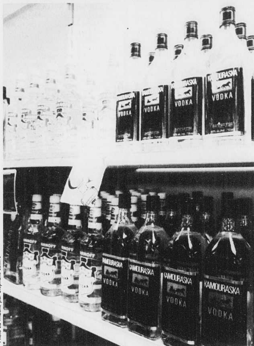
La vodka, un remède-miracle contre le cancer?

On rapporte également que 57 pour cent des femmes cancéreuses ont survécu cinq ans après le premier diagnostic, comparativement à 46 pour cent des hommes.