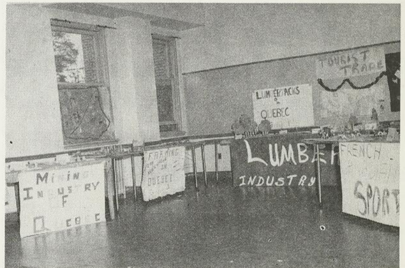
. . . et exposent

Ce n'est qu'un essai. Le succès qu'il a remporté nous permet de souhaiter que de telles initiatives, non seulement se poursuivent mais se multiplient et se répandent parmi les autres groupes ethniques.