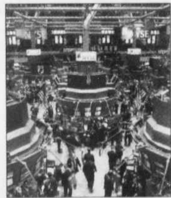
Le New York Stock Exchange

Associated Press et Agence France-Presse