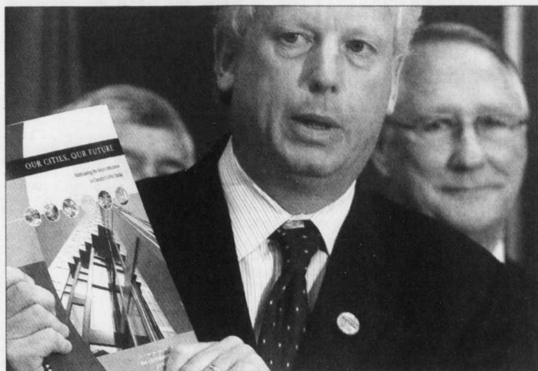
Le maire de Toronto, David Miller, exhibe le document que les 22 membres du caucus des maires des grandes villes remettront aujourd'hui à Montréal au premier ministre Stephen Harper, en demandant à être consultés dans le cadre des pourparlers sur le déséquilibre fiscal.