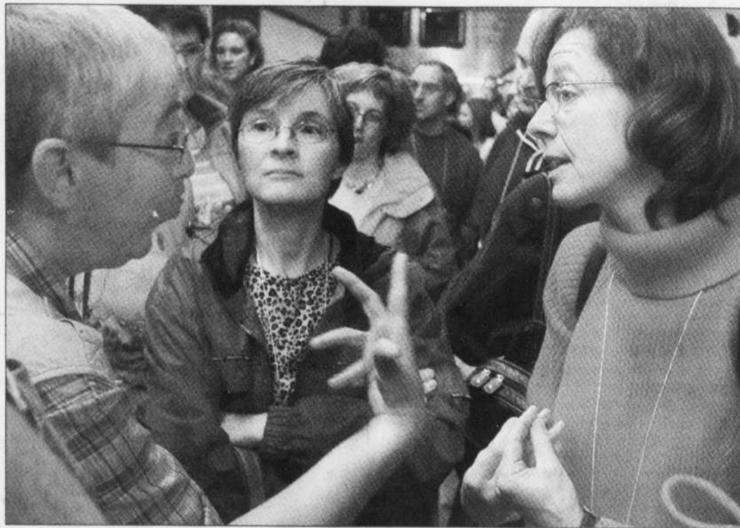
Des omnipraticiens discutent de la dernière offre du gouvernement que leur a présentée hier le président de leur fédération.