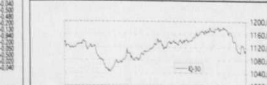
Évolution de l'Indice Composite du Québec (IQ-30)