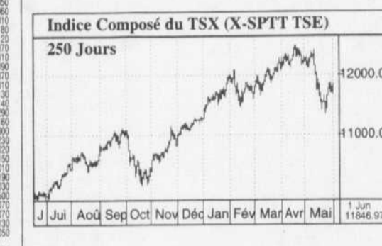
Indice Composé du TSX (X-SPTT) 250 Jours