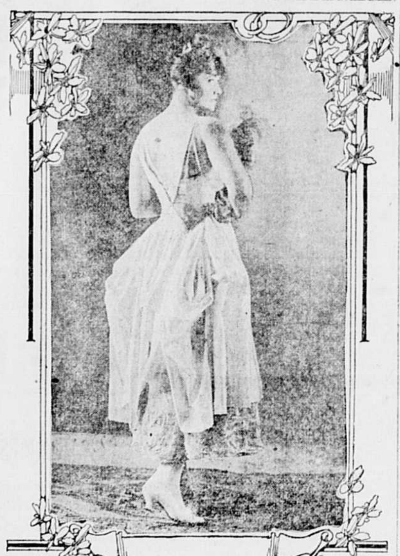
UN STYLE VRAIMENT PITTORESQUE.—On croirait à une reproduction de quelque vieux tableau à voir cette jeune fille dans le charmant costume illustré ci-dessus. Ce modèle est vraiment pittoresque avec sa blouse dentelle et ses manches bouffantes. Délicieuse aussi la combinaison de tissu en Défilé, rose et blanc. Un galon doré entre aussi dans l'ensemble, ornant une jupe tombante ainsi qu'une partie du corsage.

En ce temps-ci, on ne saurait dire exactement en quoi consiste le chic. C'est en effet presque indéfinissable ; un petit rien dans la toilette ou le chapeau, dans l'arrangement d'un noeud, d'un ruban ou d'une voilette, ou simplement dans l'allure qui fait qu'on se retourne, ravi, au passage d'une minidette aussi bien que d'une femme du monde, et que l'on murmure malgré soi : "Quel chic !" Plus facile à saisir est la distinction. Rares sont ceux qui savent se distinguer de soi-même ; elle pare de bon ton les robes les plus osées lorsqu'elle consent à les vêtir, ce qui est très rare ; elle s'érige, fière et droite, tel un lis, observant les distances ; elle n'admet pas trop de souplesse et de laisser-aller. Elle est un signe distinctif de race, bien qu'on la trouve innée chez certaines femmes, même chez des paysannes.