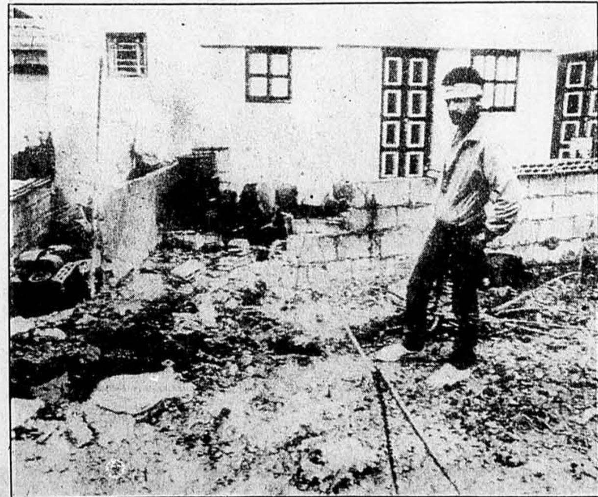
Un Palestinien contemple les dégâts.

Hier le gouvernement libanais a décidé d'envoyer des renforts à l'armée libanaise, incapable d'imposer un cessez-le-feu à Saïda. Le président Gemayel a aussi lancé un appel à l'aide à son protecteur syrien. D'ores et déjà, la situation a échappé au contrôle du pouvoir libanais.