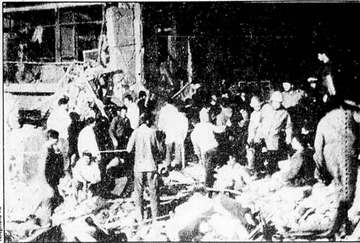
Les sauveteurs iraniens continuaient, hier, à dégager les victimes des décombres de la quarantaine d'habitations pulvérisées par le raid meurtrier de l'aviation irakienne.

Par ailleurs, M. Javier Perez de Cuellar, secrétaire-général de l'ONU, a déclaré, hier, qu'il n'avait toujours pas conclu un accord avec le gouvernement iranien sur son éventuelle visite à Téhéran dans le cadre d'une mission de paix dans la Guerre du