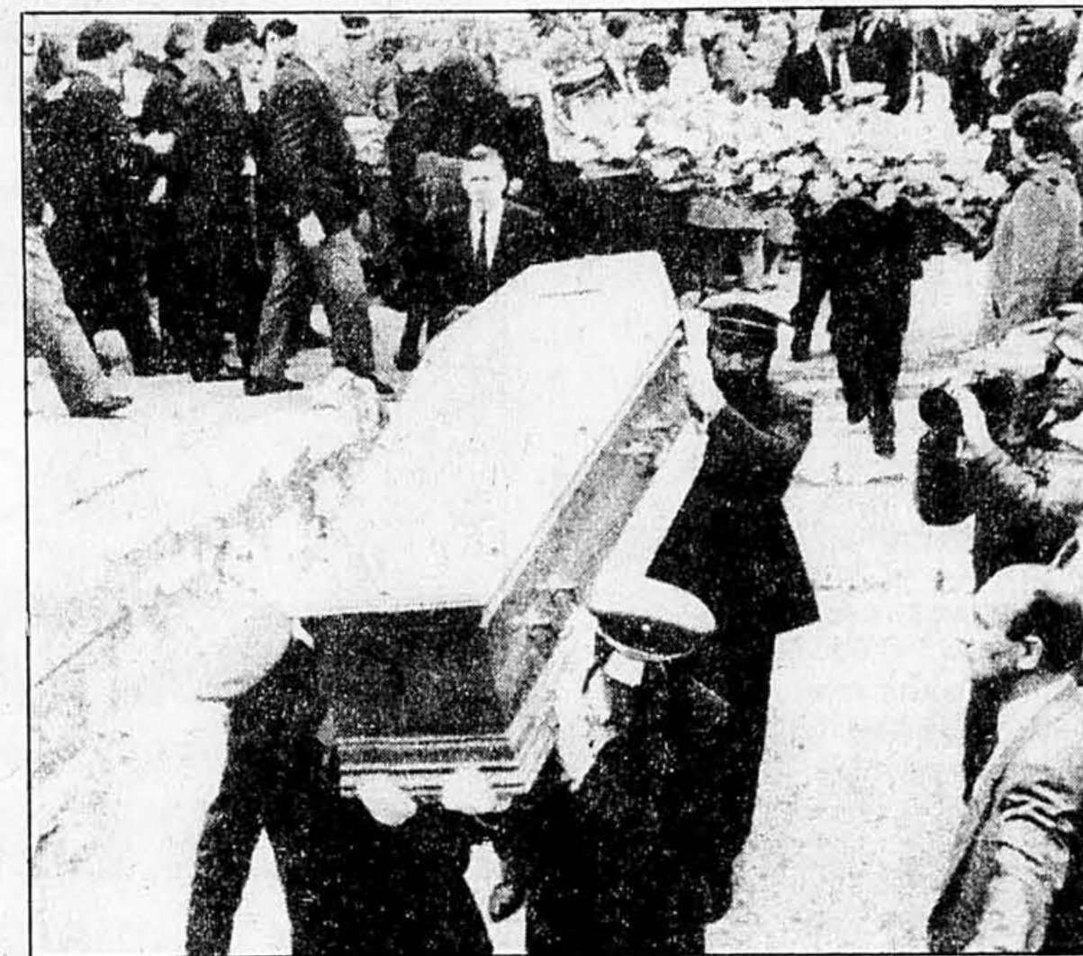
Le grand peintre Marc Chagall, décédé jeudi dernier à l'âge de 97 ans, a été inhumé hier au cimetière du petit village de Saint-Paul-de-Vence, dans le sud de la France, où il avait passé les 20 dernières années de sa vie.

Le ministre de la Culture a fait savoir à cette occasion que l'on projetait de consacrer à la mémoire de Chagall une soirée à l'Opéra de Paris, avec la participation du chef d'orchestre Mstislav Rostropovitch et d'autres amis du grand artiste.