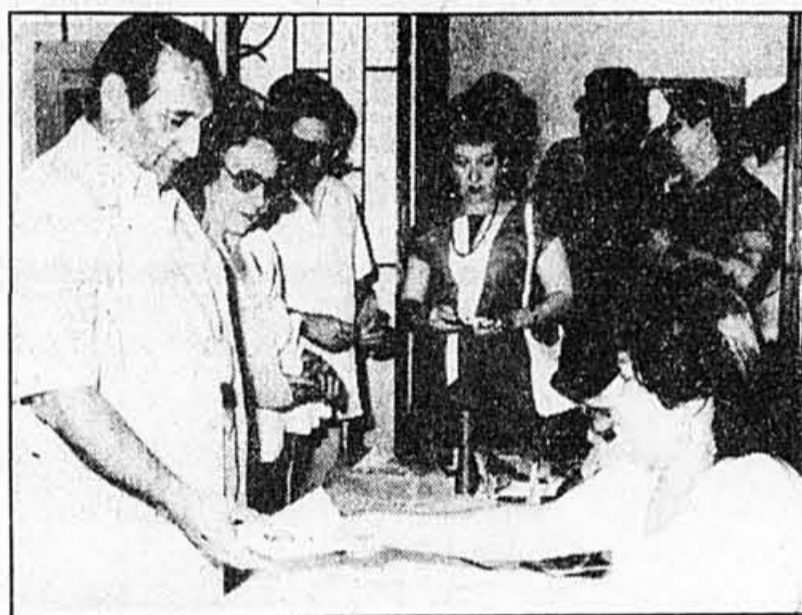
Le président Duarte, qui vote ici, et son parti, la Démocratie-Chrétienne, ont crié victoire.