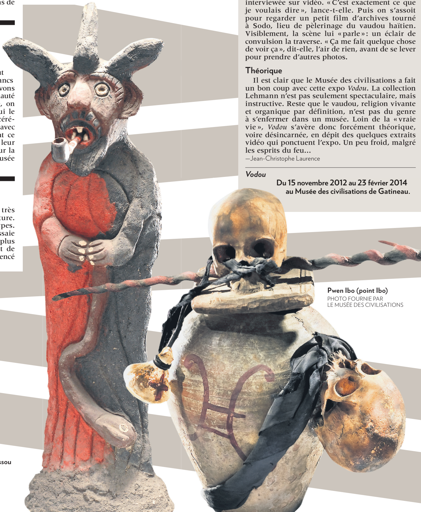
Bosou Twa Kòn ak pip (Bossou Trois Cornes avec pipe)

Du 15 novembre 2012 au 23 février 2014 au Musée des civilisations de Gatineau.