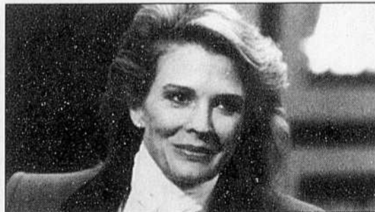
Candice Bergen dans Murphy Brown

À NOUS DEUX Début de la seconde saison d'un téléroman qui a bien plu et qui dépeint, avec plus ou moins de réalisme, le milieu des avocats. Ce soir il est question de journalisme, de police et d'intrigues amoureuses. Radio-Canada, 20h