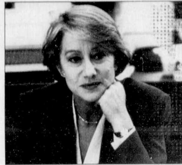
Helen Mirren, dans le rôle de Jane Tension.

Le milieu que l'on nous présente est extrêmement sensible à l'opinion publique: il faut livrer la marchandise, c'est-à-dire livrer des coupables à la foule. Et lorsque les policiers s'embourbent dans leurs gaffes et tentent par tous les moyens de les camoufler, ce n'est pas beau... Mais le plus croustillant reste sans doute la guerre des sexes à Scotland Yard.