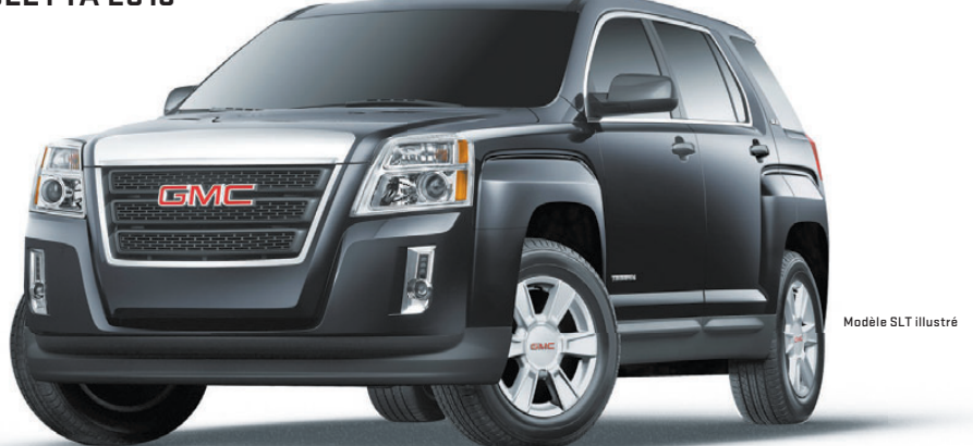
Modèle SLT illustré