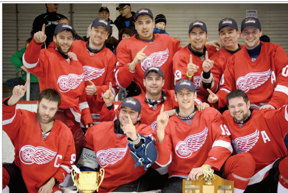
Les Red Wings remportent le championnat de la catégorie Amicale grâce à une victoire de 4-1 sur Construction LFG de Carleton-sur-Mer.