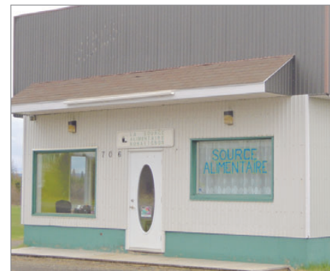
Le 26 mars, la Source Alimentaire Bonavignon souligne la journée des cuisines collectives. PHOTO COURTOISIE

(Source : La source alimentaire Bonavignon).