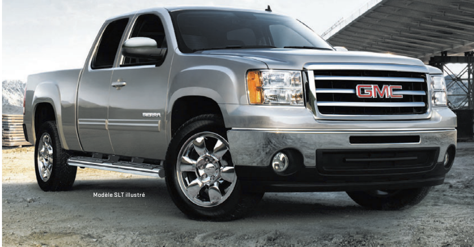
Modèle SLT illustré