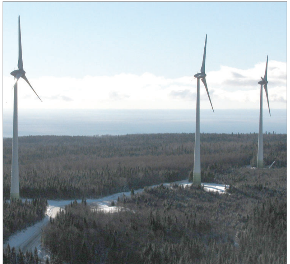
Le parc éolien de TransAlta a une puissance de 68 MW générée par 33 éoliennes de type Enercon.