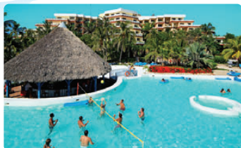
MELIA LAS ANTILLAS