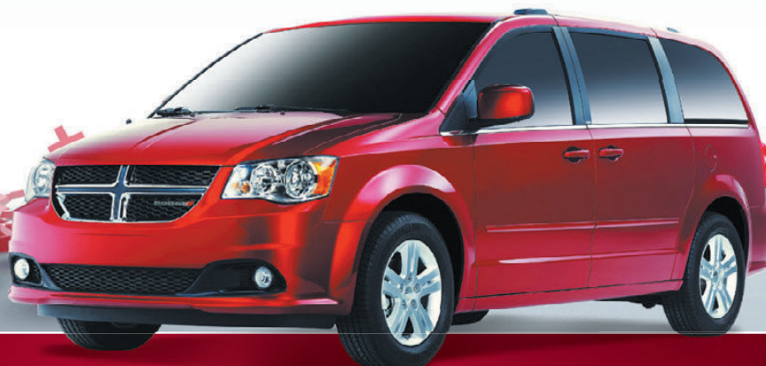
Dodge Grand Caravan Crew 2013 montrée**

ENSEMBLE M ^ X DODGE GRAND CARAVAN SXT 2013