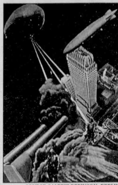
La guerre du futur (1930), d'Alexandre Rodchenko, illustre l'affiche de l'exposition qui se déroule au CCA jusqu'au 24 septembre.