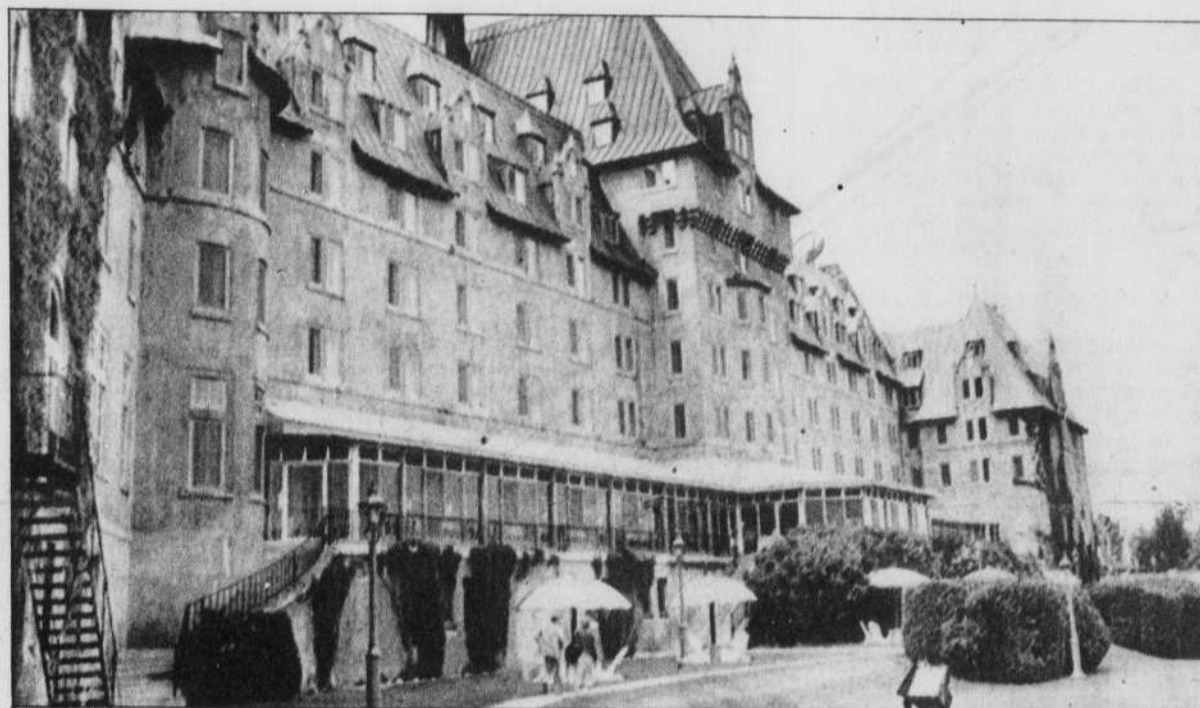
Le Manoir Richelieu de Pointe-au-Pic connaît cet été un taux d'occupation record de 85 %.