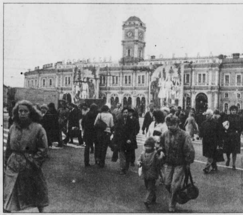
Tallinn, capitale de l'Estonie et vitrine occidentale de l'Union soviétique.