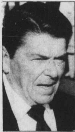
M. Ronald Reagan

WASHINGTON — La bataille électorale américaine aura peut-être finalement lieu: après avoir réussi à naviguer sans encombre au dessus de la mêlée dans une sérénité toute présidentielle, Ronald Reagan rencontre des pépins dans son scénario, et se voit contraint de croiser le fer. C'est bien toujours le même Ronald Reagan, bardé d'optimisme qui va affronter dimanche son adversaire Walter Mondale au cours de leur premier débat télévisé (il y en aura deux entre les candidats à la présidence, un autre entre les candidats à la vice-présidence.) Mais c'est aussi un président qui vient de connaître deux semaines plus difficiles que prévu.