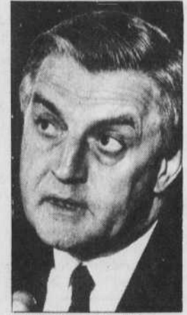
M. Walter Mondale