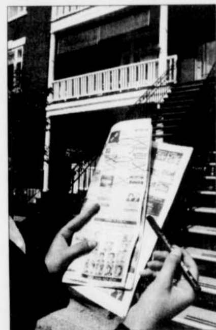
Un lecteur se moque de la « misère » des proprios.