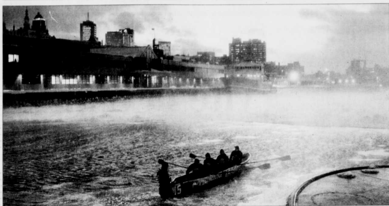
L'équipe de l'Hôtel-Dieu a commencé l'entraînement à l'eau en décembre, avec un vieux canot de fortune, le temps que sa nouvelle embarcation soit prête. Puis, elle est passée à l'entraînement intensif en janvier, avec le nouveau canot.