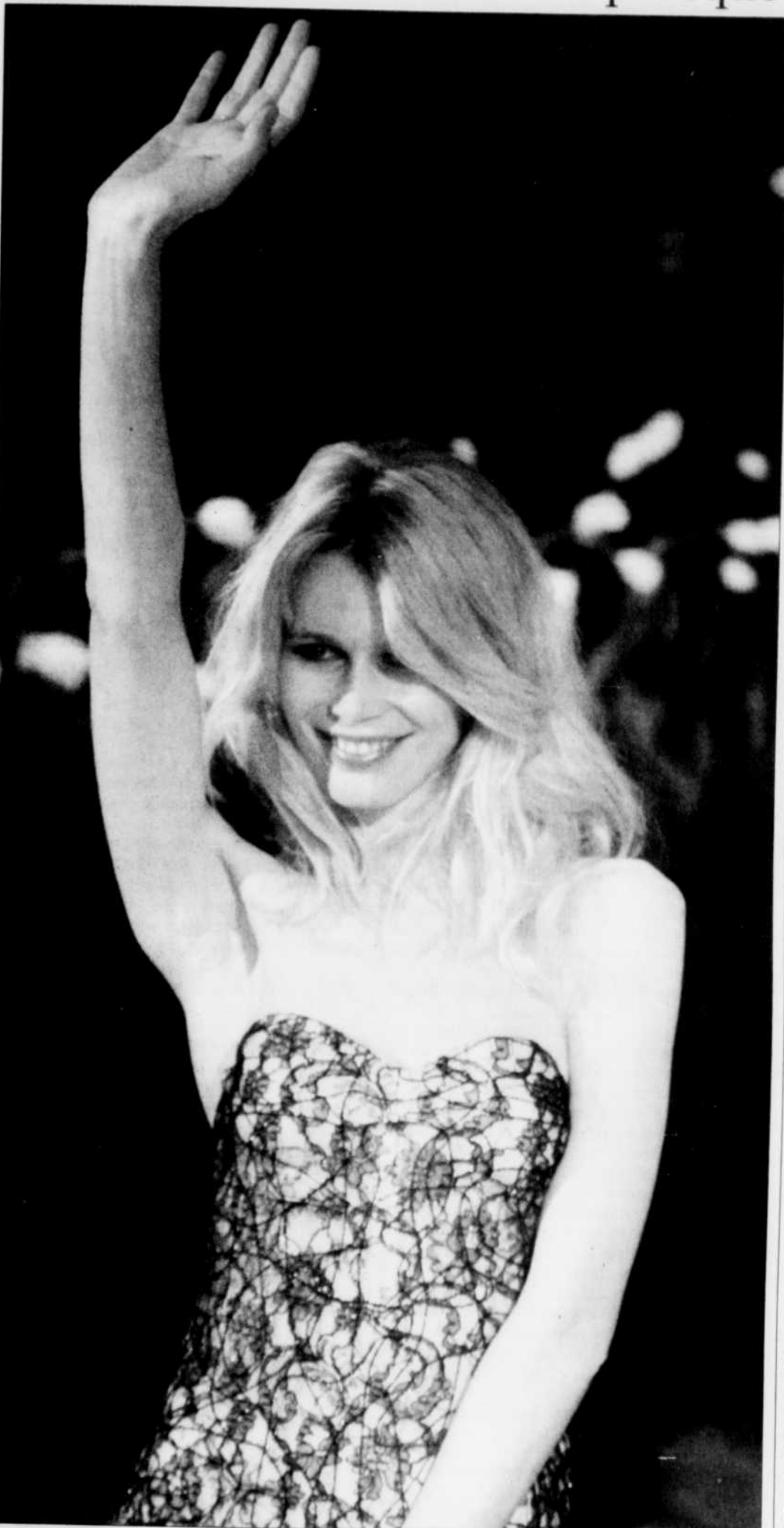
La mannequin Claudia Schiffer à son arrivée hier au Festival du film de Berlin.