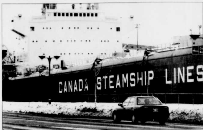
L'empire maritime Canada Steamship Lines (CSL) continue de hanter le premier ministre Paul Martin.

Tous savent que Paul Martin est multimillionnaire, qu'il a fait sa fortune avec la Canada Steamship Lines et ses filiales, que la compagnie est enregistrée à l'étranger pour éviter de payer taxes et impôts au Canada, pays dont il est actuellement premier ministre. Tous doivent savoir que M. Martin a placé sa compagnie, la CSL, dans une fiducie sans droit de regard lorsqu'il est entré au cabinet, qu'il a transféré la propriété de sa