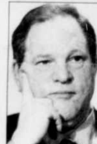
Avec son franc-parler, le patron de Miramax, Harvey Weinstein, a sauvé l'ouverture du Festival, où les étoiles brillent par leur absence.

« Vous connaissez ma réputation, si je n'ai pas pu les faire venir, personne d'autre n'aurait pu. » Liste à la main, le vieux pro a d'abord