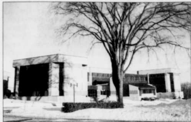
Le terrain où est érigé le collège Jésus-Marie domine le Saint-Laurent.

■ Un projet de développement résidentiel pourrait bientôt voir le jour sur des terrains appartenant actuellement aux Sœurs de Jésus-Marie, dans un site très convoité avec vue sur le fleuve.