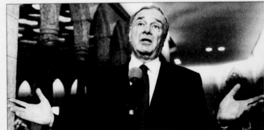
Immédiatement après le discours du Trône de Paul Martin, une première volée d'indignations quant aux empiétements sur les domaines de compétence des provinces a fusé.

Pour connaître la réponse à cette question, il faudra attendre la révision de la politique étrangère dont l'échéancier a été précisé: une étude terminée à l'automne prochain et des résultats qui passeront ensuite par le crible d'un comité parlementaire. Et s'il y avait des élections entre-temps? On se targue que,