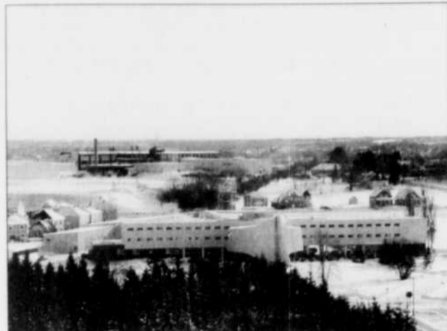
Le litige réside dans l'interprétation que font les différentes parties des clauses visant à assurer la vocation d'enseignement du campus.