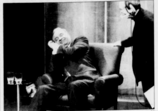
Paul Martin a fait semblant de s'endormir avant sa participation à un forum avec des électeurs, hier, à Radio-Canada. Pendant l'émission, il a notamment qualifié de « virtuel » le surplus de l'assurance-emploi de 45 milliards $ et affirmé qu'il n'abrogerait pas la Loi sur la clarté référendaire. Il a même prédit qu'il n'y aurait pas de référendum durant son mandat.

Il a nié avoir été une « taupe » pour le Bloc